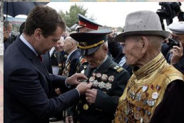
Д. А. Медведев вручает российские награды ветеранам Халхин-Гола (Улан-Батор, 2009)