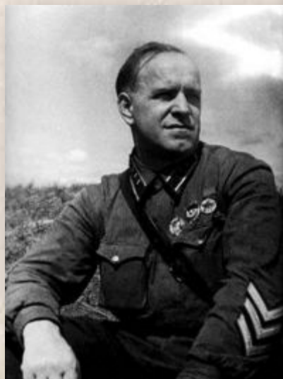
Комдив Г. Жуков на Халхин-Голе

1939 г. – вторжение Японии в Монголию. СССР оказал военную помощь Монголии. Вооружённый конфликт, продолжавшийся с весны по осень 1939 года у реки Халхин-Гол на территории Монголии, закончился разгромом японских войск.