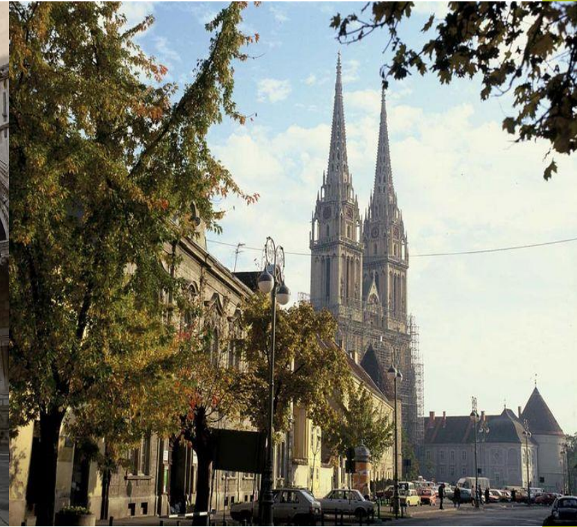
Загребський кафедральний собор