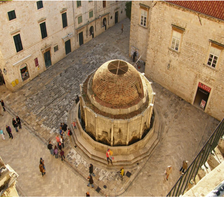
Великий фонтан Онофрио