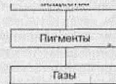
Рис. 5.1. Компоненты молока