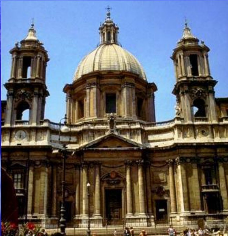
Франческо Барромини. Церковь Сант Аньезе. 1653 г. Рим.

Характерные черты итальянского барокко нашли наиболее яркое воплощение в творчестве двух зодчих, создавших целую эпоху в развитии архитектуры, - Франческо Борромини и Лоренцо Бернини.