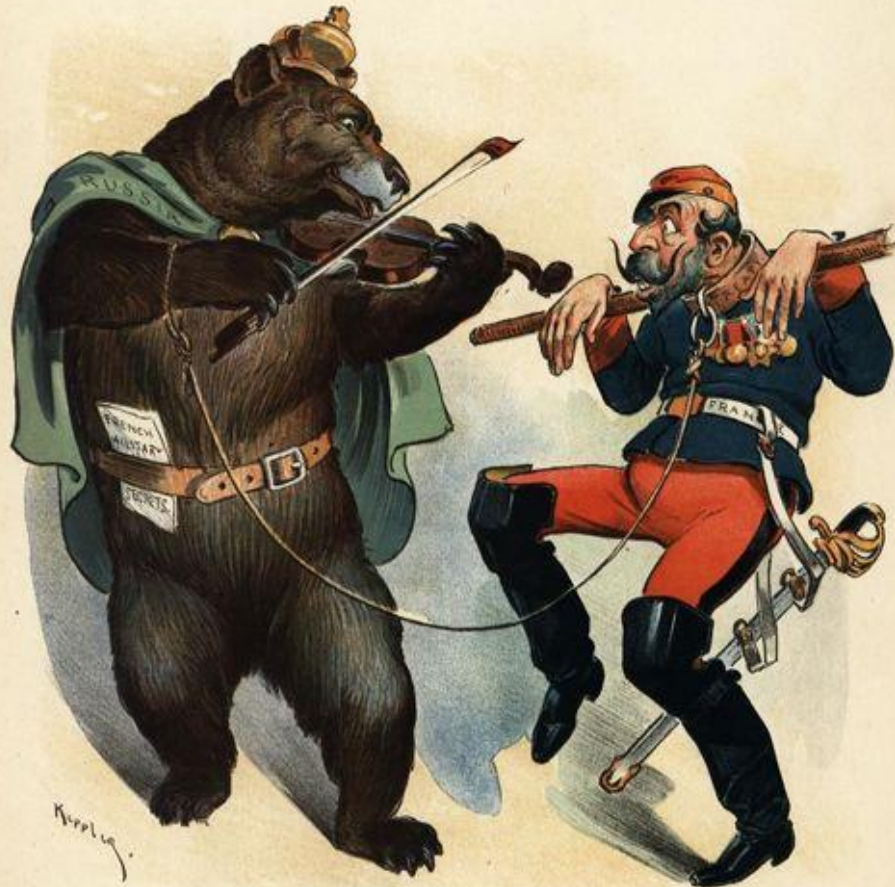
THE RUSSIAN-FRENCH ALLIANCE.

Entered at N. Y. P. O. as Second-class Mail Matter.