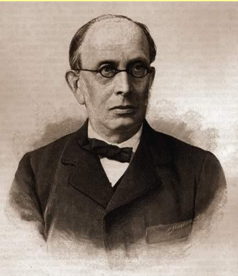
Константин Петрович Победоносцев (1827 – 1907), обер-прокурор Св. Синода.

Огромным влиянием на Александра III пользовался его воспитатель, обер-прокурор Св. Синода К.П. Победоносцев.