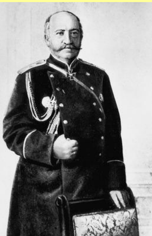
Николай Павлович Игнатьев.

Игнатьев хранил проект в тайне от других министров и собственных сотрудников, всецело полагаясь на славянофильские симпатии Александра III.