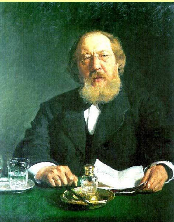
Иван Сергеевич Аксаков (1823–1886).

Под влиянием московских славянофилов во главе с И.С. Аксаковым Н.П. Игнатьев предложил созвать Земский собор (3 тыс. депутатов от дворян и горожан на основе имущественного ценза, 1 тыс. – от крестьян).