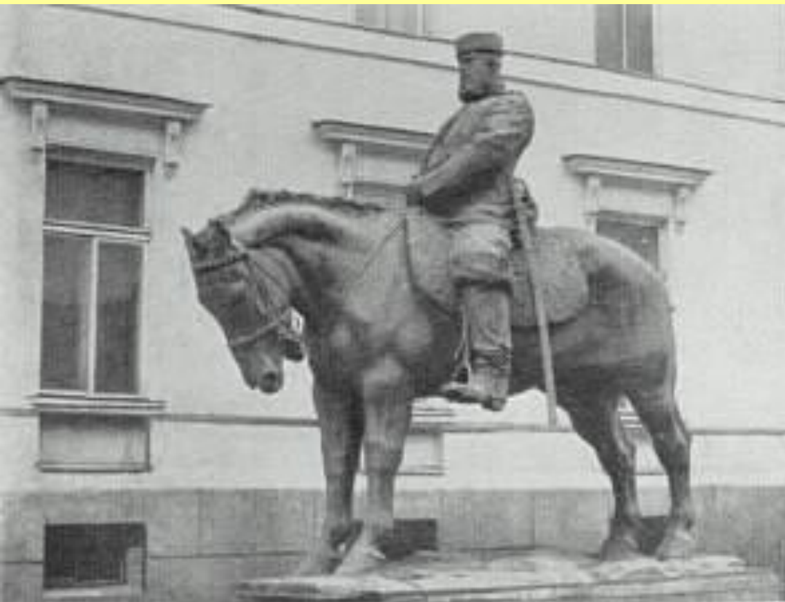
Памятник императору Александру III. Скульптор Паоло Трубецкой.

Петербуржцы говорили про этот памятник: «Стоит комод, на комодe – бегемот, на бегемоте – идиот».