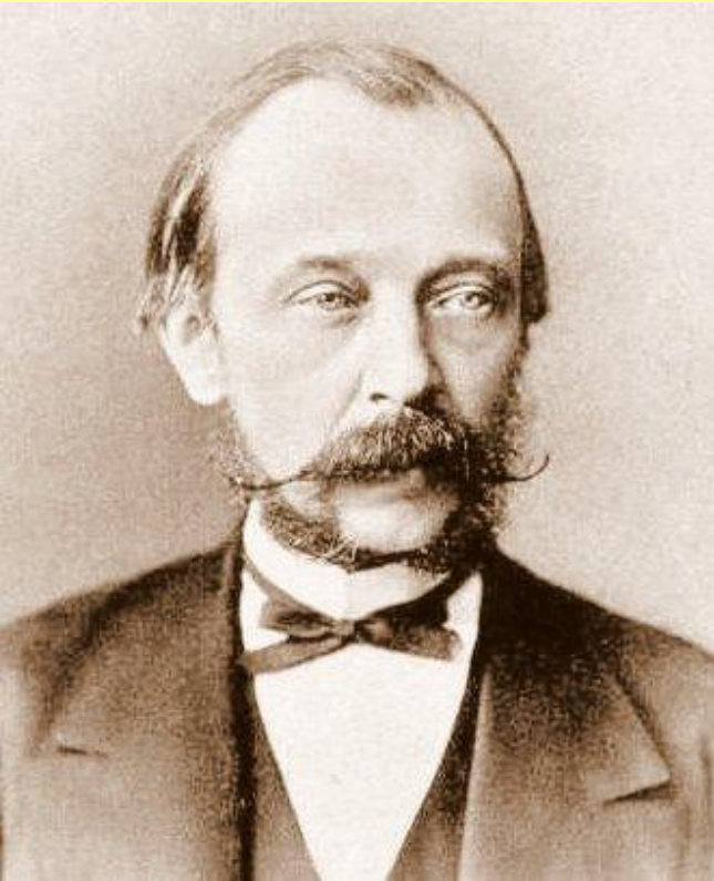
Граф Дмитрий Андреевич Толстой (1823–1889), министр внутренних дел в 1882–1889 гг.

В мае 1882 г. МВД возглавил Д.А. Толстой.