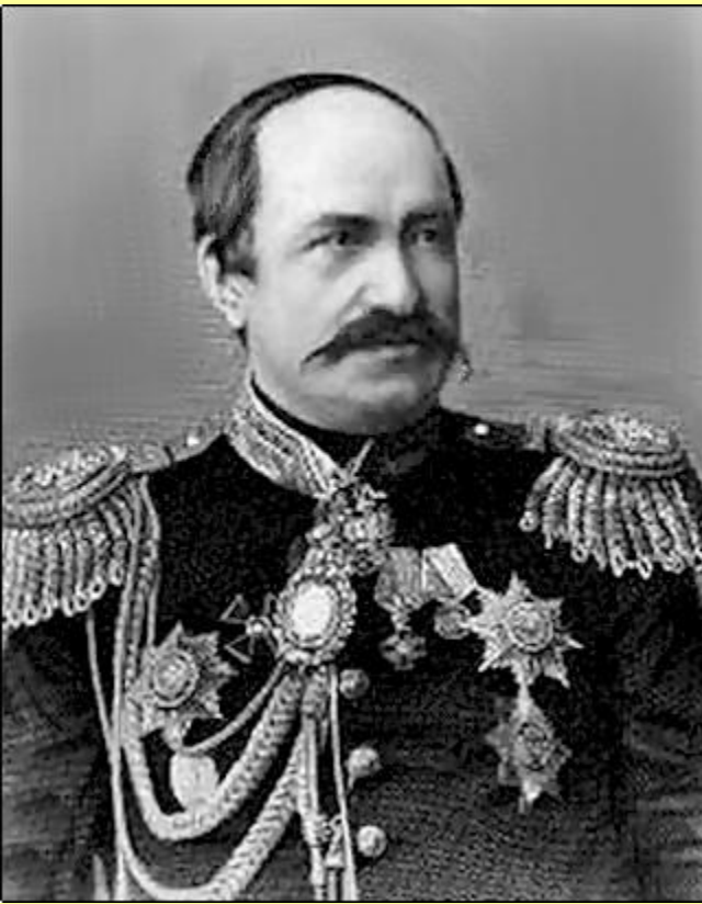
Николай Павлович Игнатьев (1832–1908).

В мае 1881 г. после издания манифеста «О незыблемости самодержавия» М.Т. Лорис-Меликов ушел в отставку.