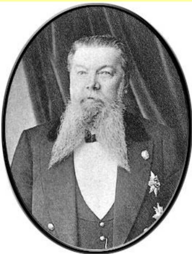
Иван Николаевич Дурново