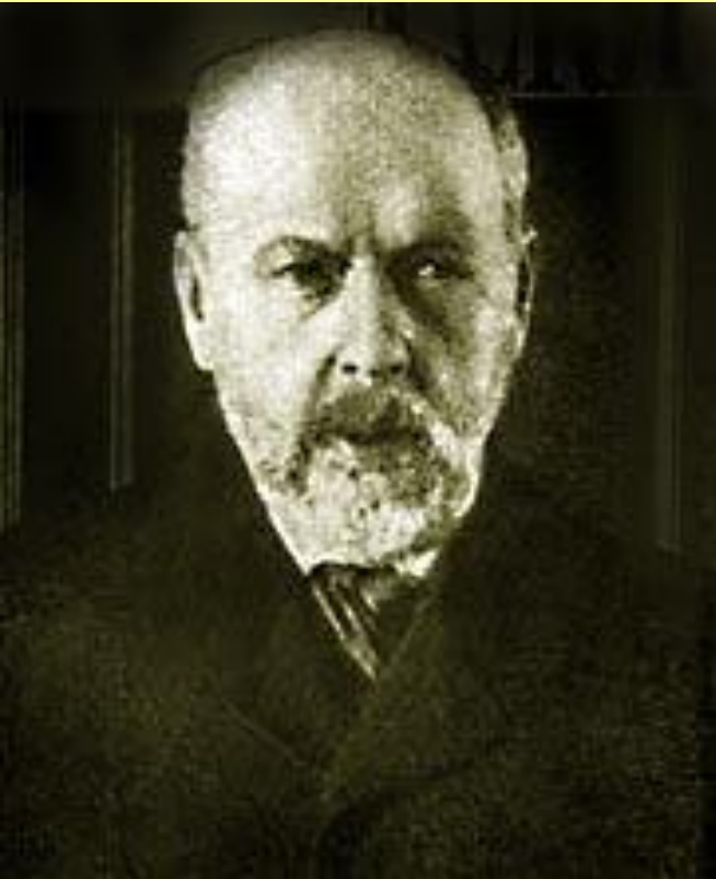
Князь Владимир Петрович Мещерский (1839–1914) в старости.

Немалым влиянием на Александра III пользовался кн. В.П. Мещерский, близкий к нему еще с 60-х гг.