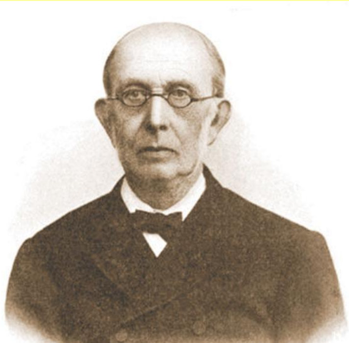
Константин Петрович Победоносцев

Из статьи Победоносцева «Великая ложь нашего времени»: