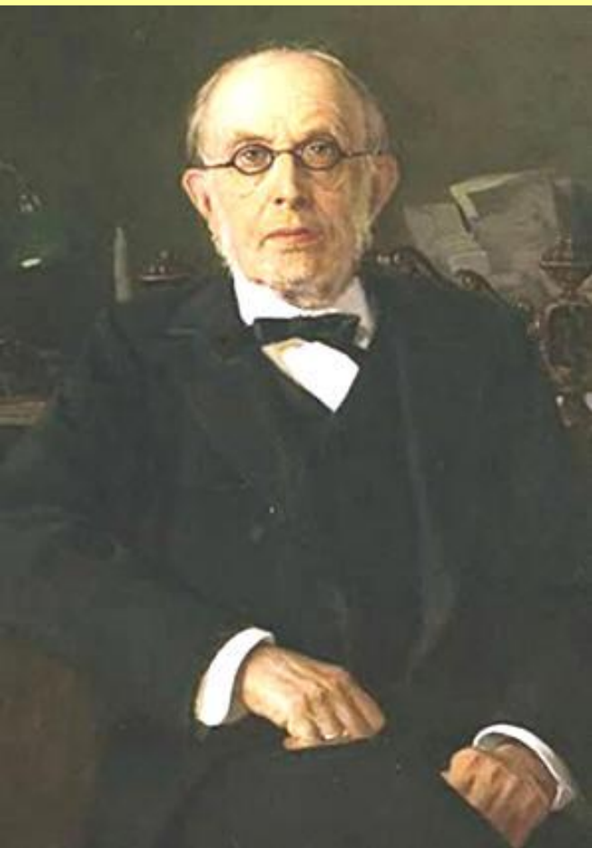
Константин Петрович Победоносцев