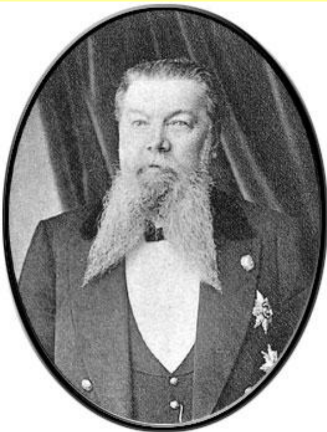
Иван Николаевич Дурново