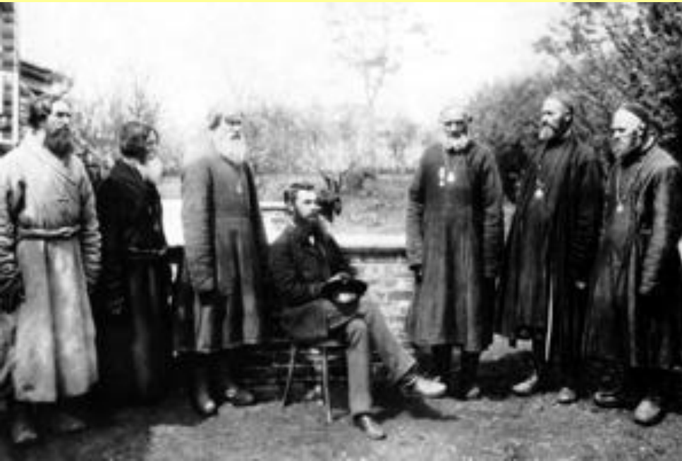
Волостные старшины у земского начальника. Нижегородская губерния, 1891 г.

Земский начальник назначал членов волостных правлений из предложенных крестьянами кандидатов, мог отменять решения волостных судов, штрафовать крестьян и арестовывать на срок до 7 дней.