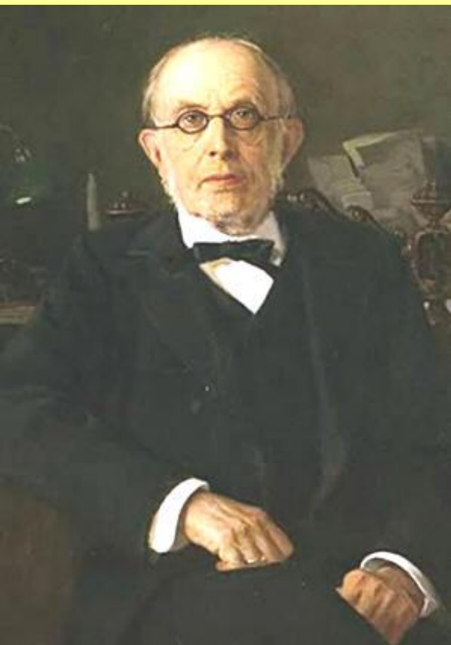
Константин Петрович Победоносцев