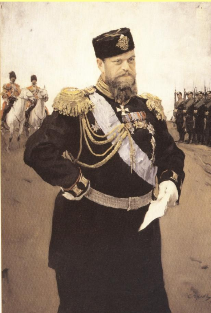
Портрет Александра III с рапортом в руках. Худ. В. Серов.

«Это был тип действительно самодержавного русского царя; а понятие о самодержавной русском царе неразрывно связано с понятием о царе как покровителе-начальнике русского народа».