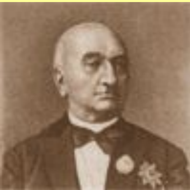
Иван Давидович Делянов (1818–1897), министр просвещения в 1882–1897 гг.

В 1887 г. Делянов издал доклад «О сокращении гимназического образования», повысив оплату за обучение в гимназиях и прогимназиях. Не рекомендовалось принимать «детей кучеров, лакеев, поваров, прачек, мелких лавочников и тому подобных людей, детей коих, за исключением разве одаренных необыкновенными способностями, вовсе не следует выводить из среды, к коей они принадлежат, и чрез то... приводить их к озлоблению против неравенства имущественных положений»