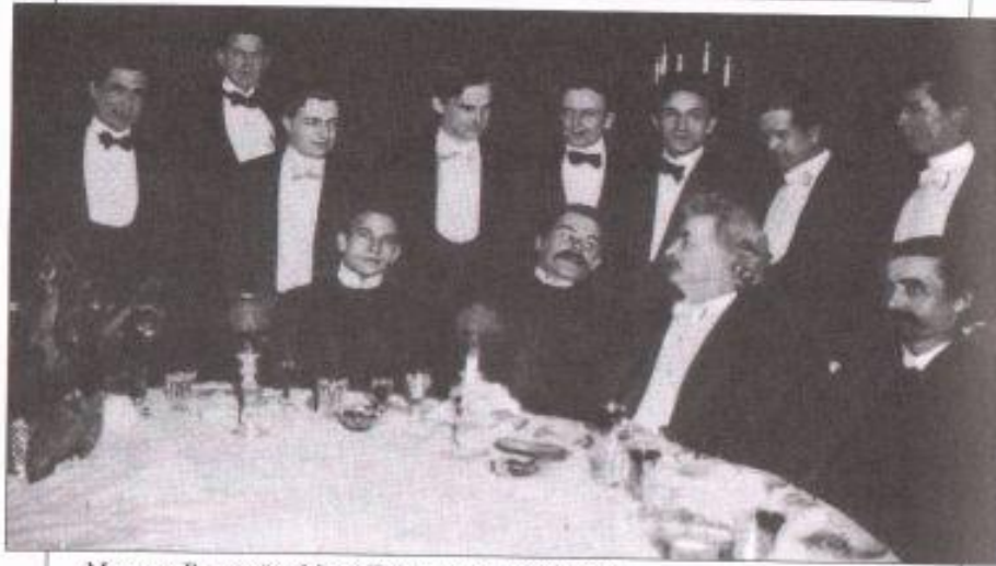
Максим Горький и Марк Твен в клубе писателей. Нью-Йорк, 1906