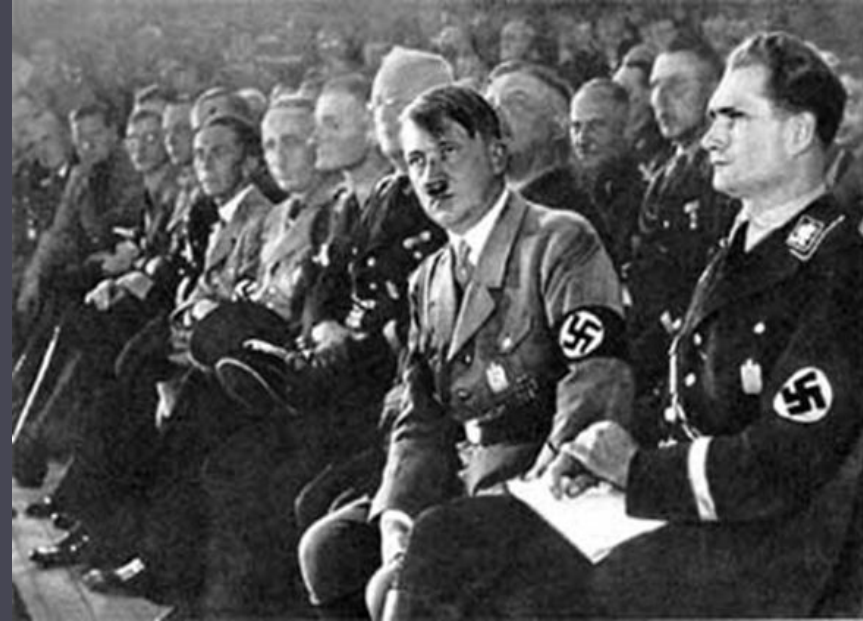
Гітлер на з'їзді нацистської партії в момент прийняття програми, Нюрнберг, 1933 р.