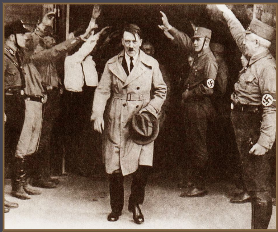
Прихід А.Гітлера до влади

30.01.1933р. – президент Гінденбург призначає А. Гітлера рейхсканцлером