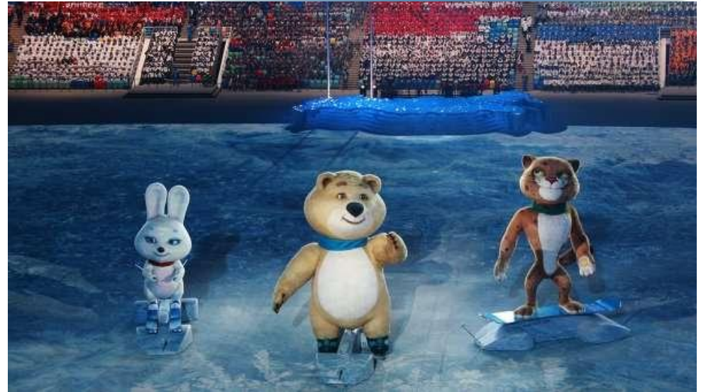
Церемония открытия XXII Зимних Олимпийских игр