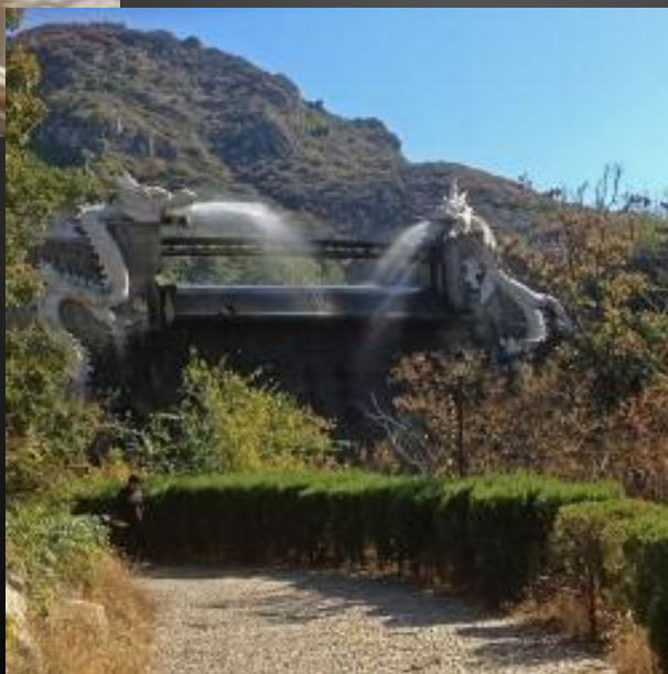
← Драконы в парке Белого Дракона