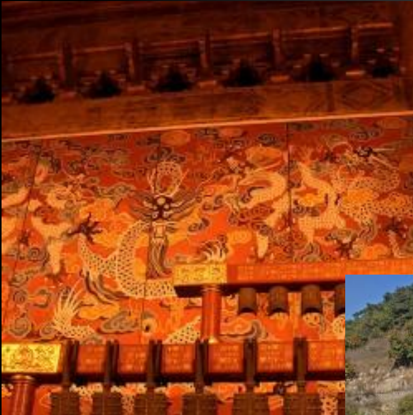
Изображение драконов в музее Гугуна, Пекин