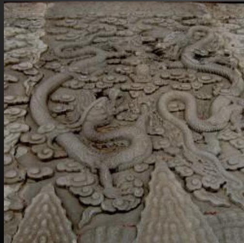
Драконы, барельеф. Гугун, Пекин