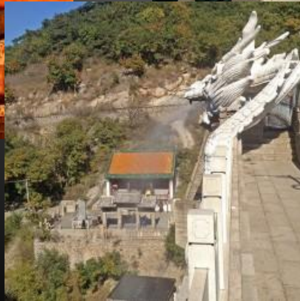
Дракон в парке Белого Дракона