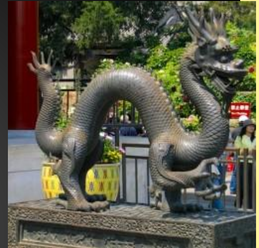
Дракон в парке Ихэюань, Пекин