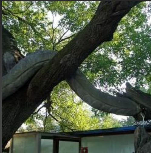
Дракон в парке Бадачу, Пекин