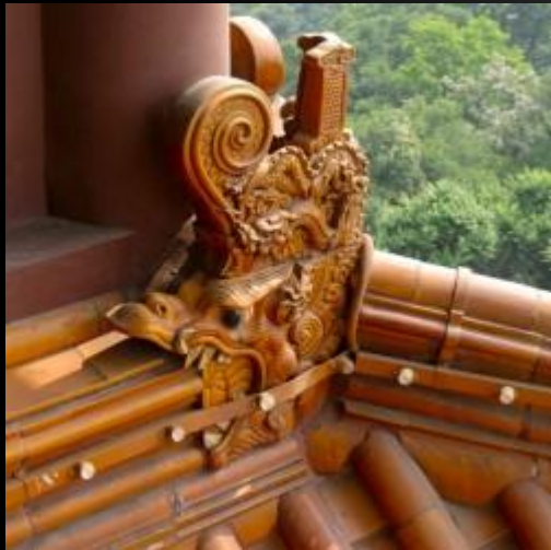
Дракон на крыше Хуанхэлоу, Ухань