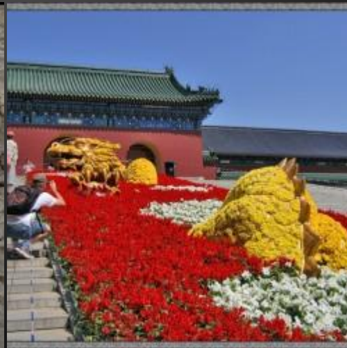
Клумба с драконо м в парке Храма Неба, Пекин