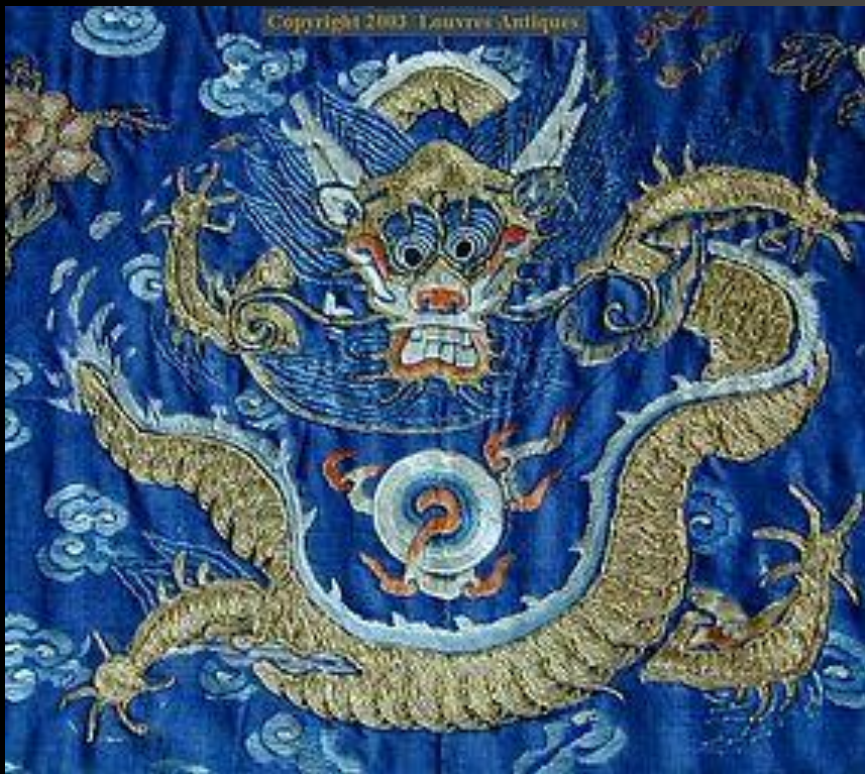
лазурный дракон (фрагмент одежды императора Китая)