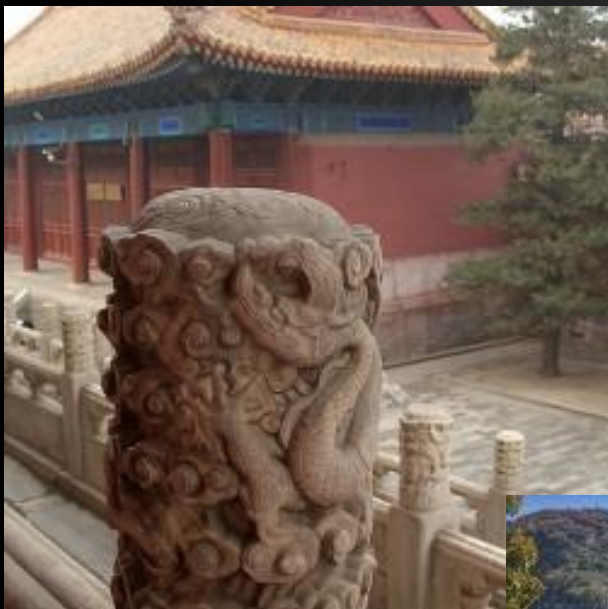
← Барельеф с драконами, Гугун, Пекин →