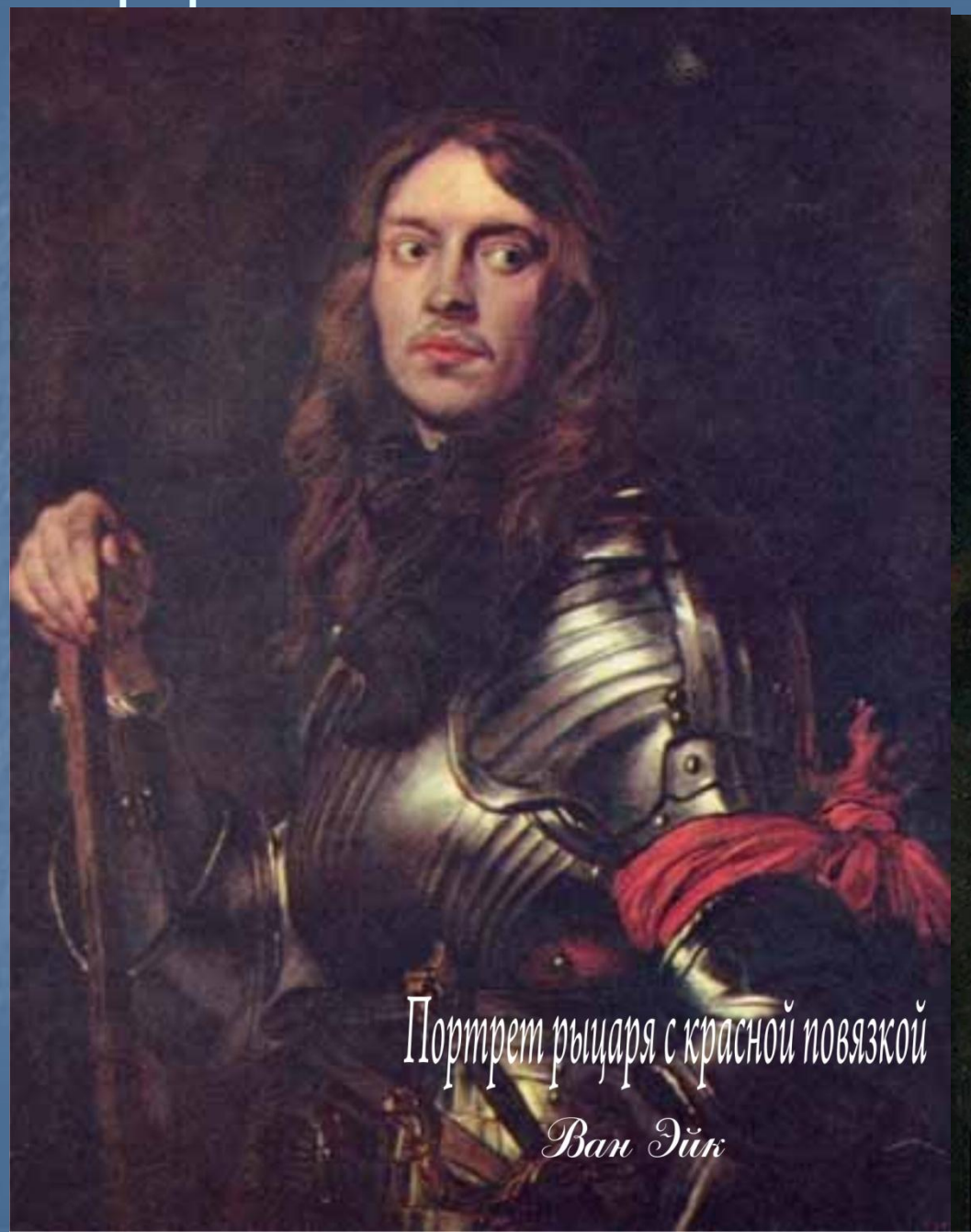
Портрет рыцаря с красной повязкой