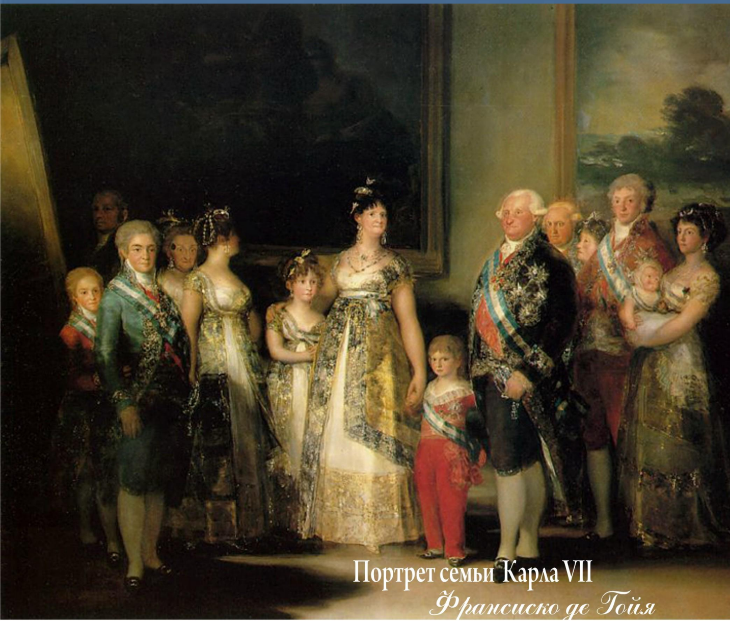
Портрет семьи Карла VII Франсиско де Гойя