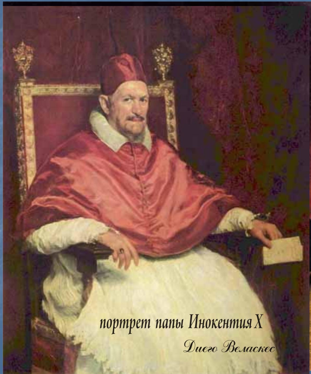
портрет папы Иннокентия X