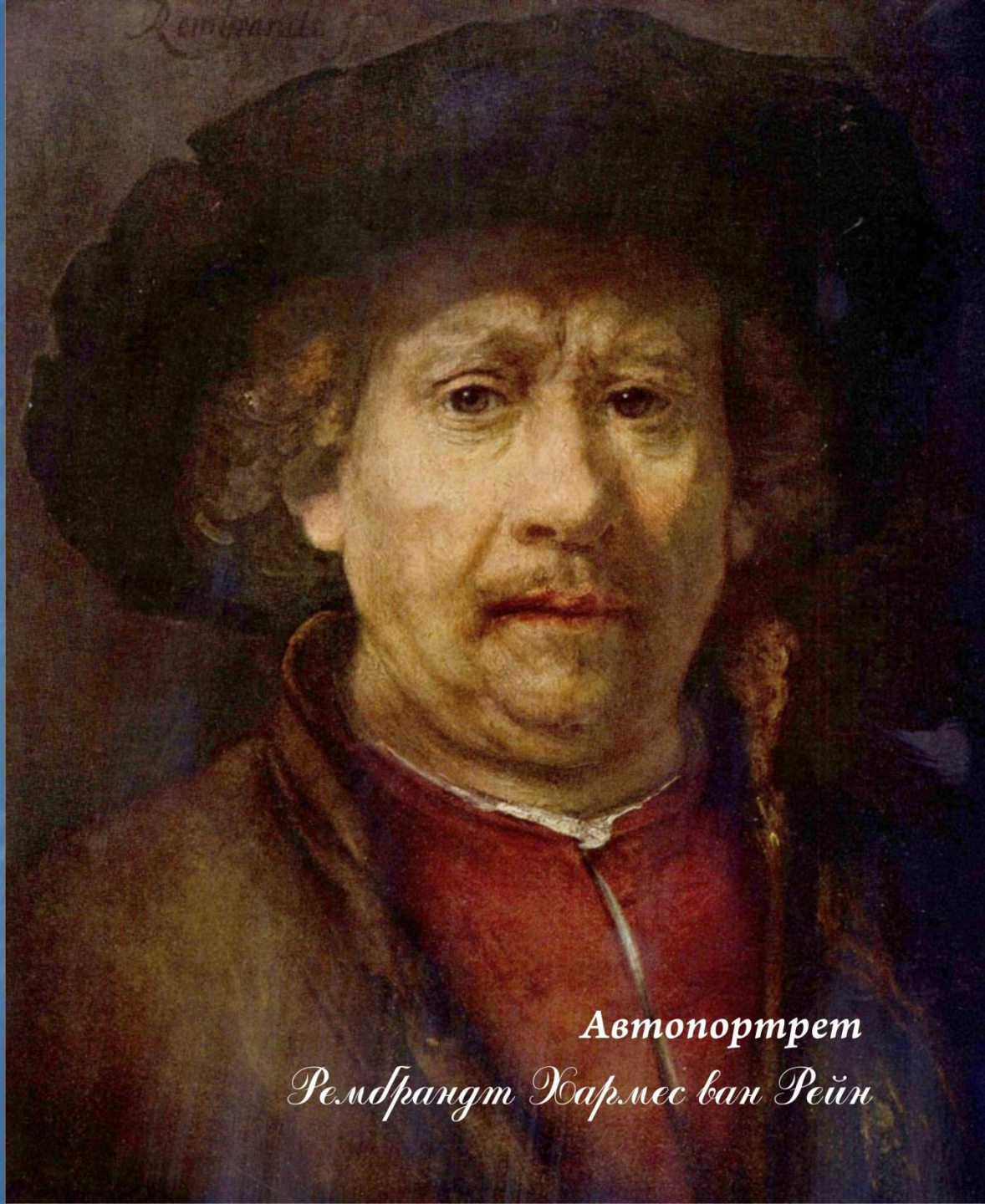
Автопортрет Рембрандт Хармес ван Рейн