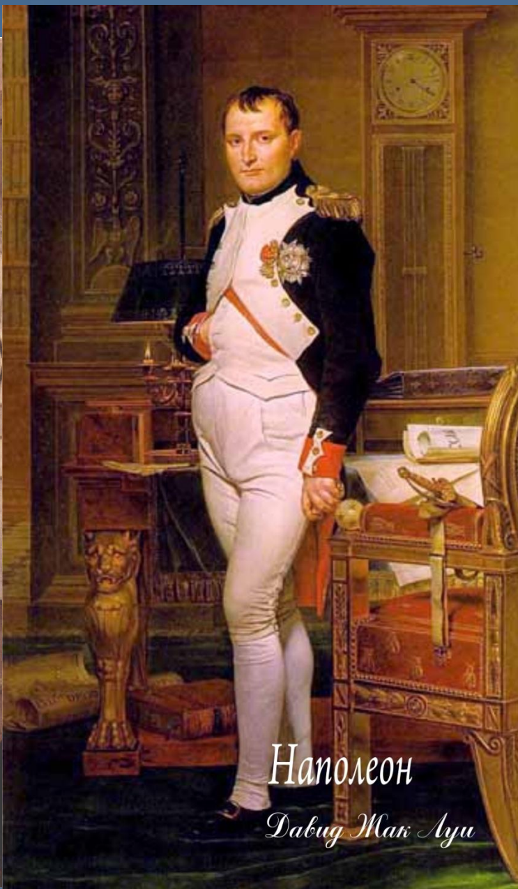
Наполеон Давид Жак Луи