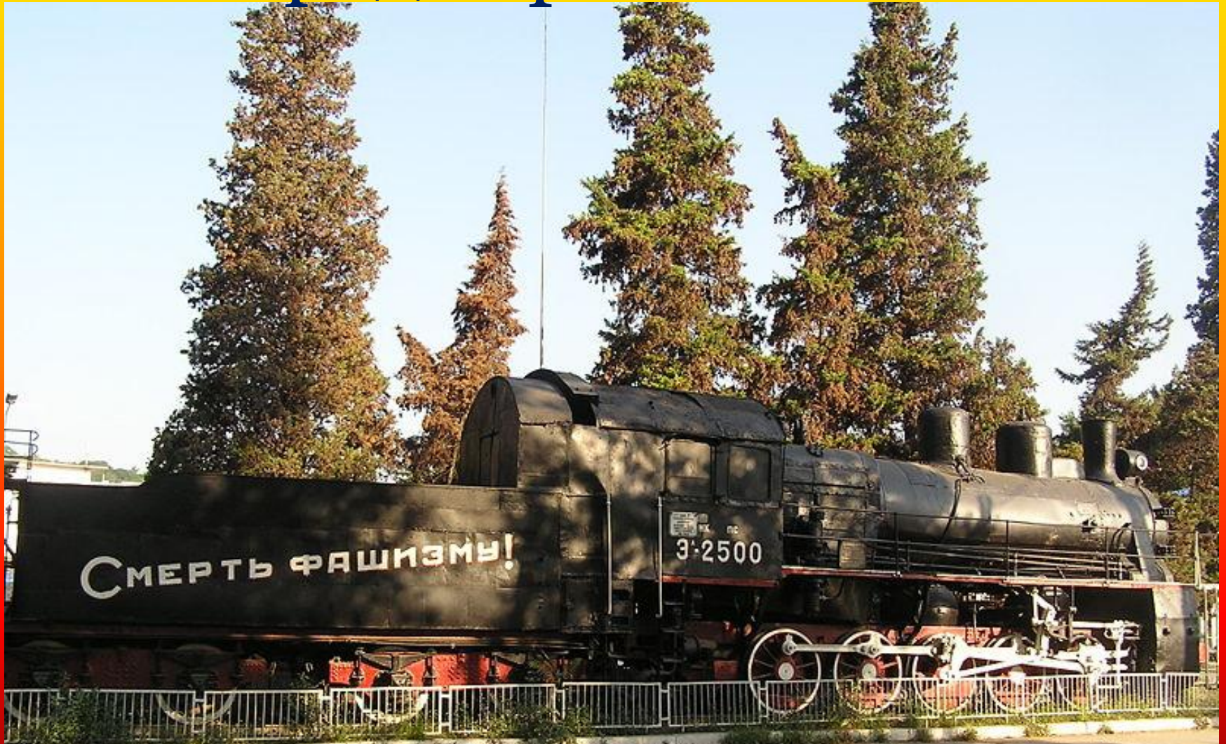
Памятник бронепоезду «Железняков»