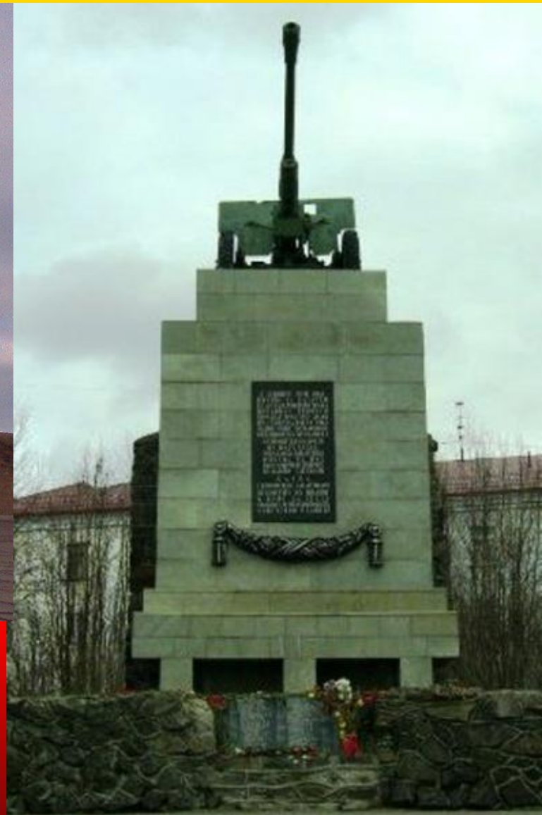
Памятник 6-й гвардейской батарее