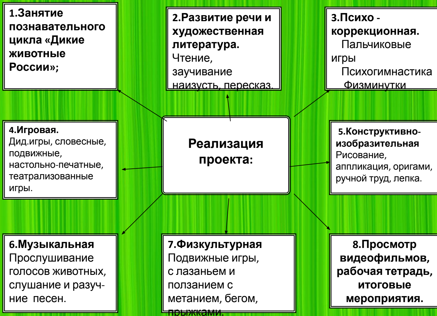
Схема реализации проекта через виды деятельности Схема-модуль