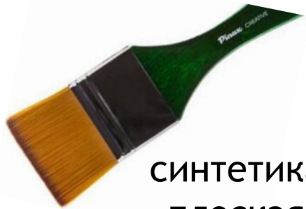
синтетика плоская большая