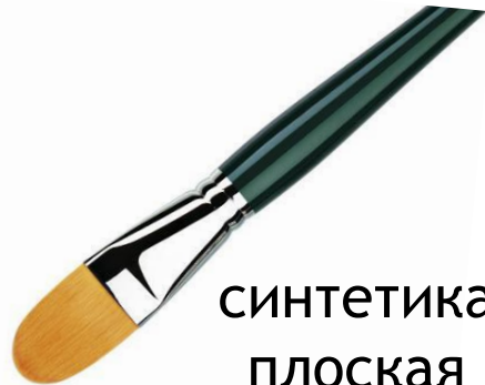
синтетика плоская закругленная средняя