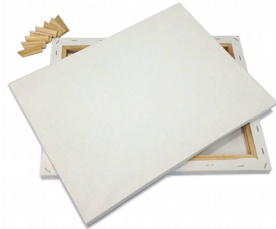
холст на подрамнике