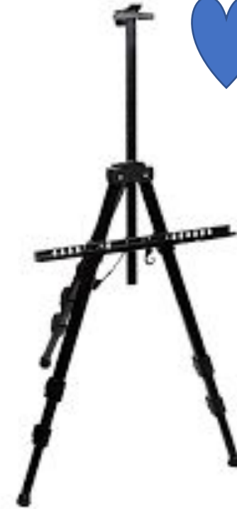
Пленэрный мольберт (металлическая тренога)