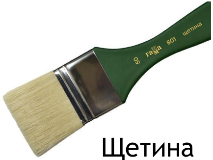
Щетина Плоская большая