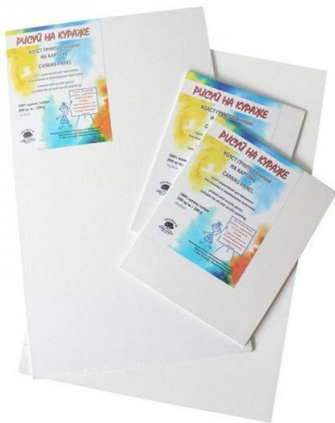
. Холст на картоне