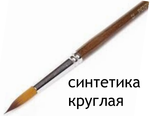
синтетика круглая средняя