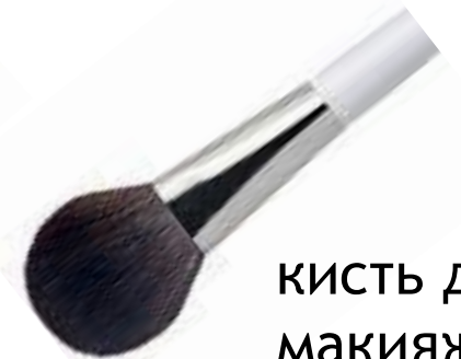
кисть для макияжа