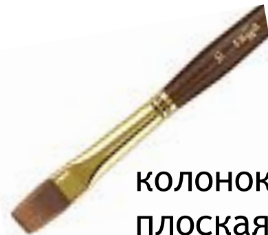
колонок плоская средняя