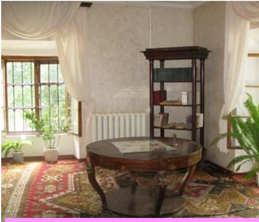
Робочий стіл Бальзака у Верхівні