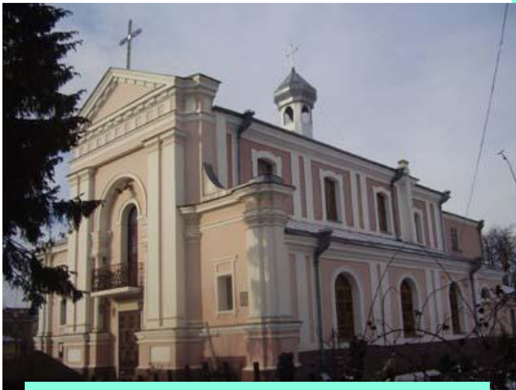
Костьол Святої Варвари міста Бердичів

У 1850 році одружився з Евеліною Ганською.