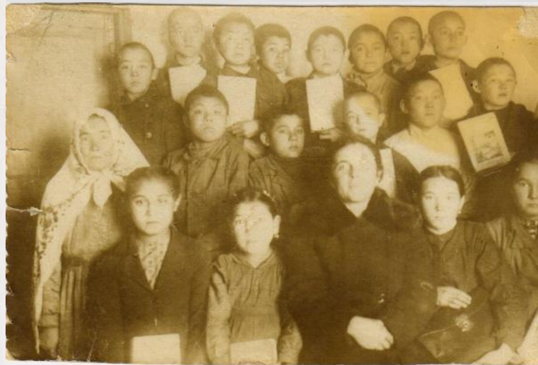
Дети войны... 1949 год, школа г.Баймак