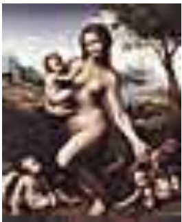
«Леда с лебедем» (1508-1514)