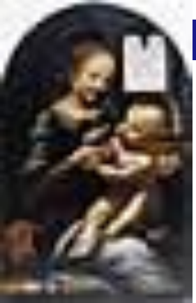
"Мадонна Бенуа" (1478-1480)