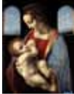
«Мадонна Литта» (1478-1482)