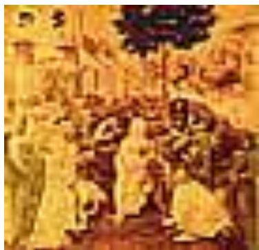
«Поклонение волхвов» (1472-1477)