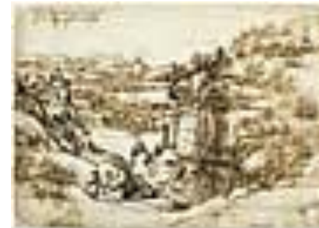
«Долина реки Арно». Чернила, карандаш, бумага (15 августа 1473)