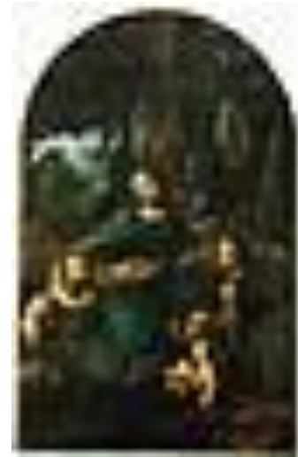
«Мадонна в скалах» («Мадонна в гроте») (1483-1486)