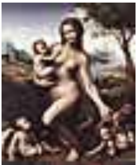
«Леда с лебедем» (1508-1514)