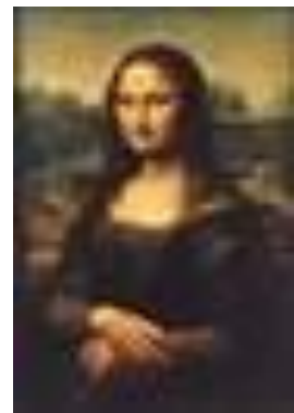
"Мона Лиза" Джоконда (1503-1506)