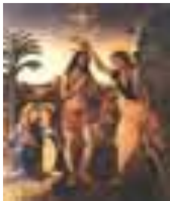
«Крещение Христа». Масло и темпера на панели (1473-1475)