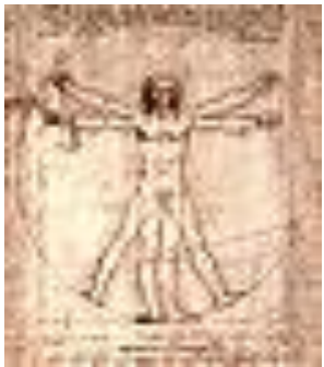
"Витрувианский человек" Пропорции человека