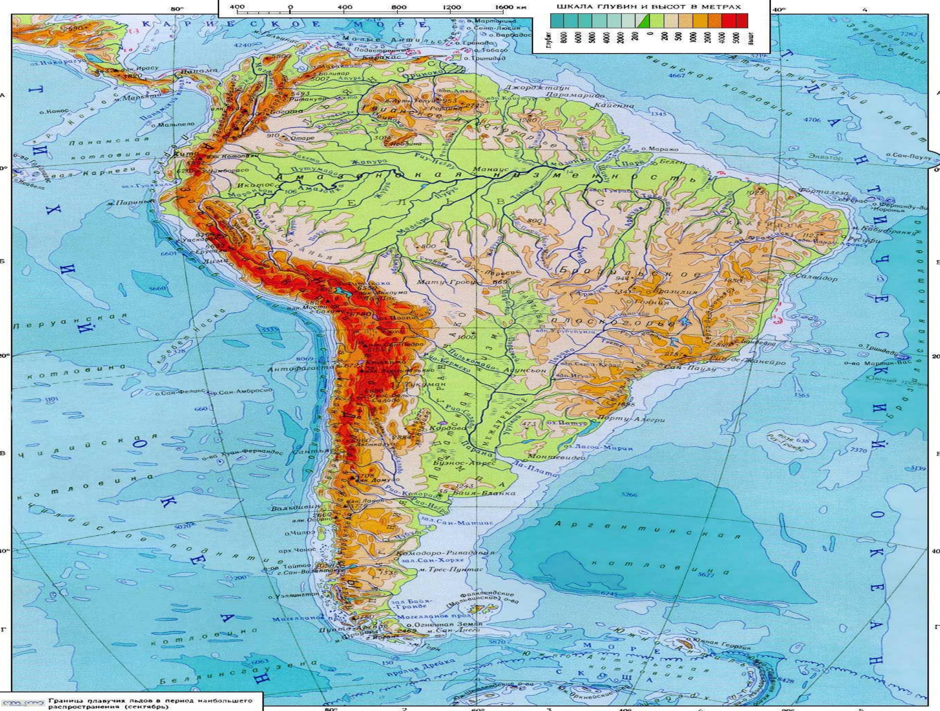
Границы плавучих льдов в период наибольшего распространения (сентябрь)