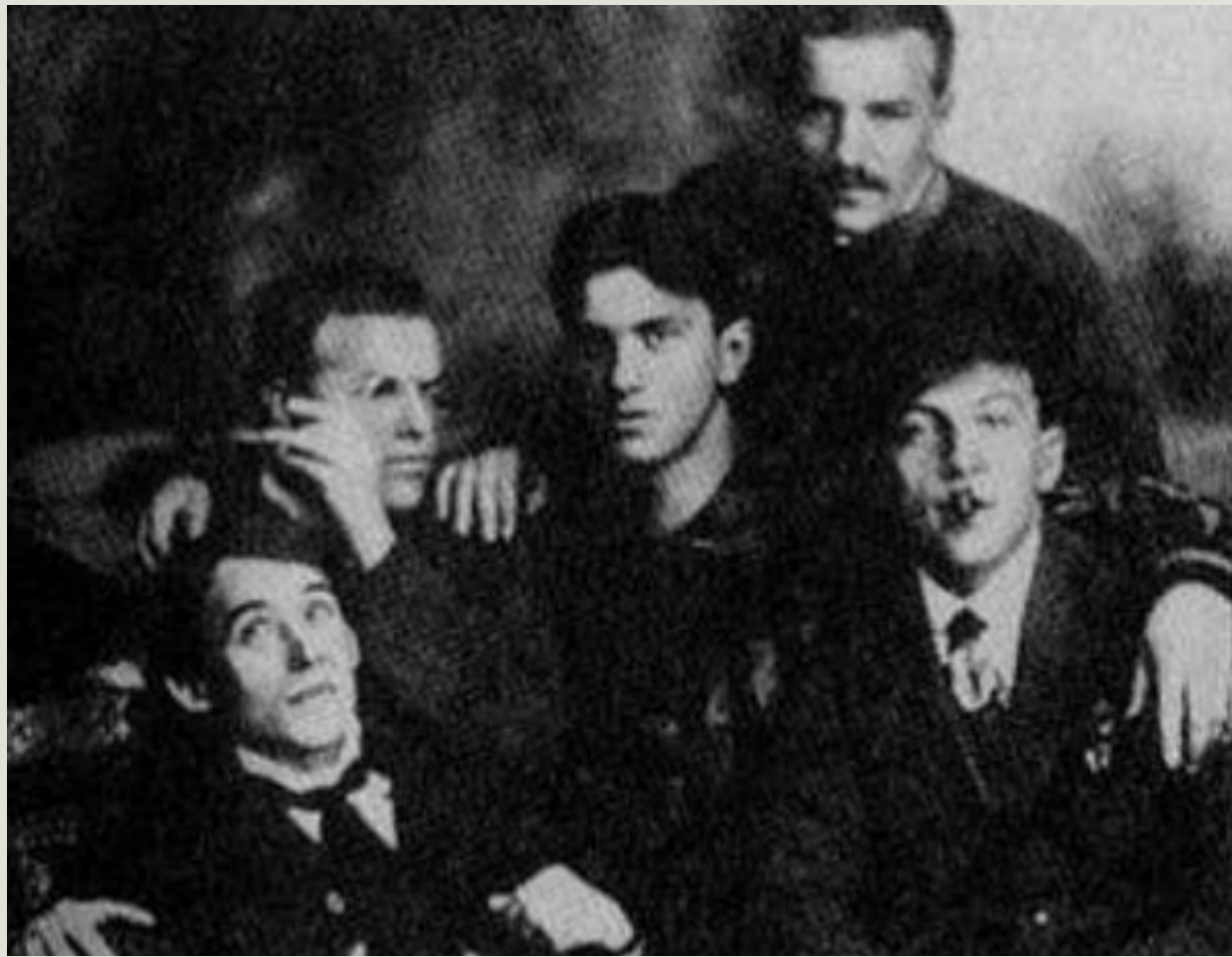
Слева направо: А.Крученых, Д.Бурлюк, В. Маяковский, В.Бурлюк, Б.Лифшиц