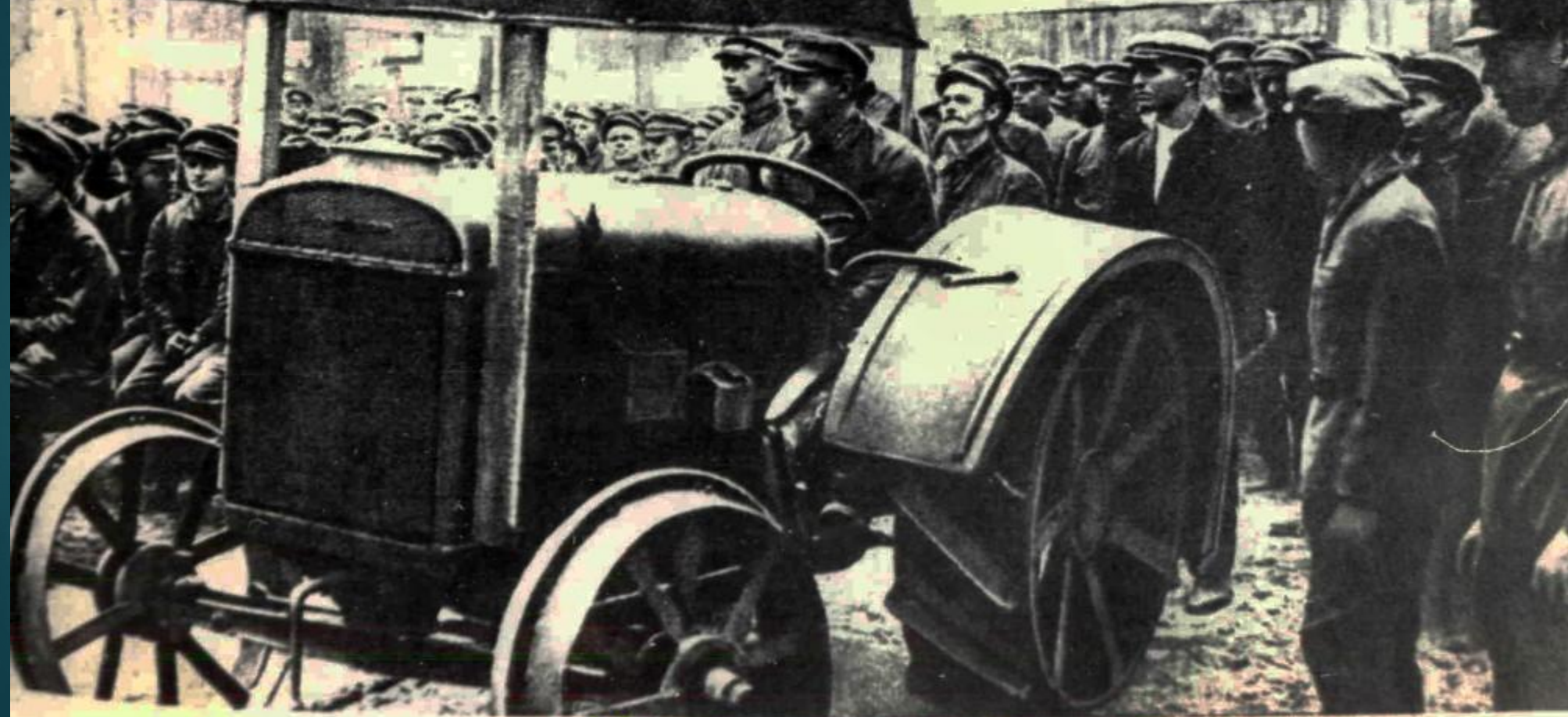
Агитработа среди красноармейцев на терсборах. 1930 г.

КРАСНОАРМЕЕЦ-КОЛХОЗНИК! ПРИЙДЕШЬ ДОМОЙ, ПОЙДИ ПО ДВОРАМ ЕДИНОЛИЧНИКОВ И ЗОВИ ИХ ТОЖЕ В КОЛХОЗ. Будь действительной и прочной опорой Советской власти!