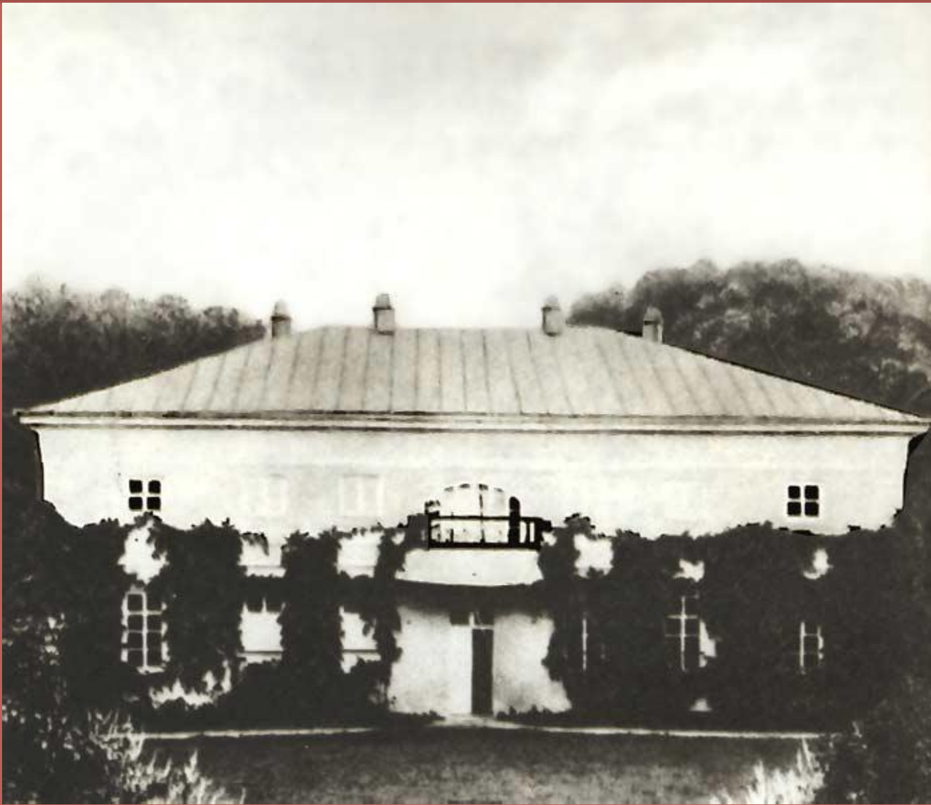
Дом Фета в усадьбе Воробьевка