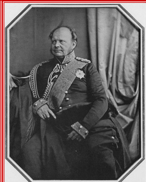
Король IVФридрих Вильгельм

1848 ж. наурызда – Пруссияда революция басталды