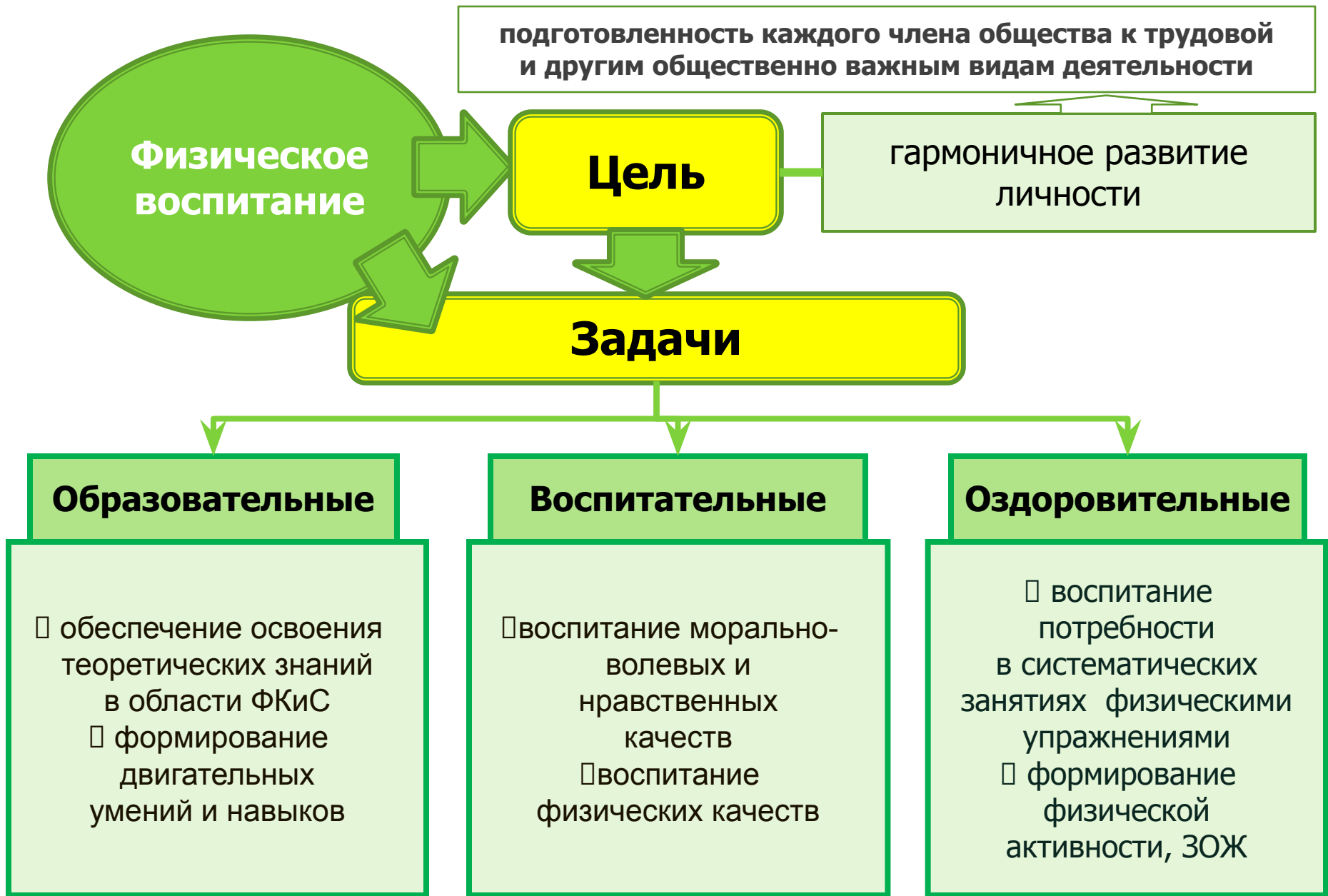
Рис. 7. Цель и задачи ФВ