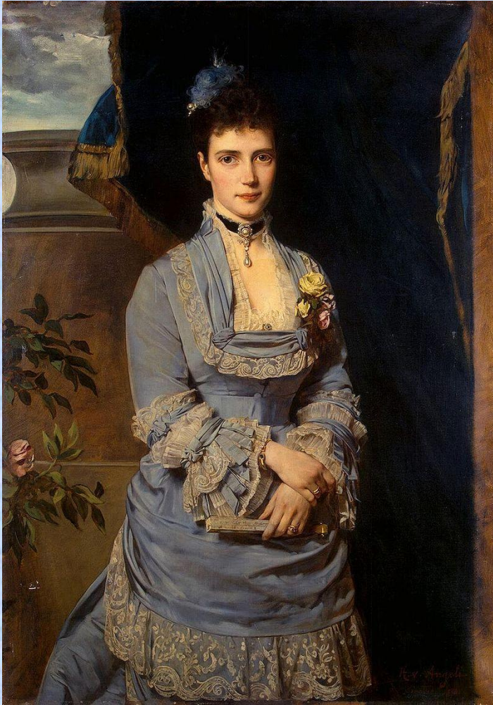
Императрица Мария Фёдоровна