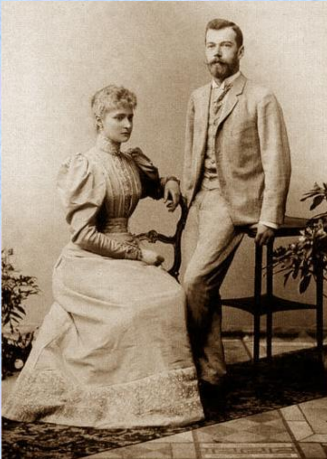
Цесаревич Николай Александрович и принцесса Алиса Гессенская после помолвки