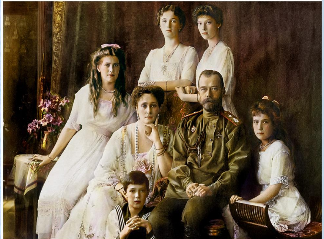
Николай II со своей семьей