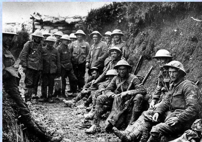
Редкие фото времен Первой мировой войны