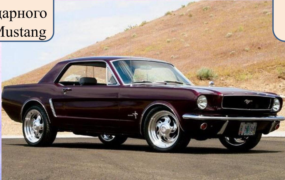
Ford Mustang (1964)

Мощность в зависимости от года выпуска варьируется от 306 л. с. до 550 л.с.