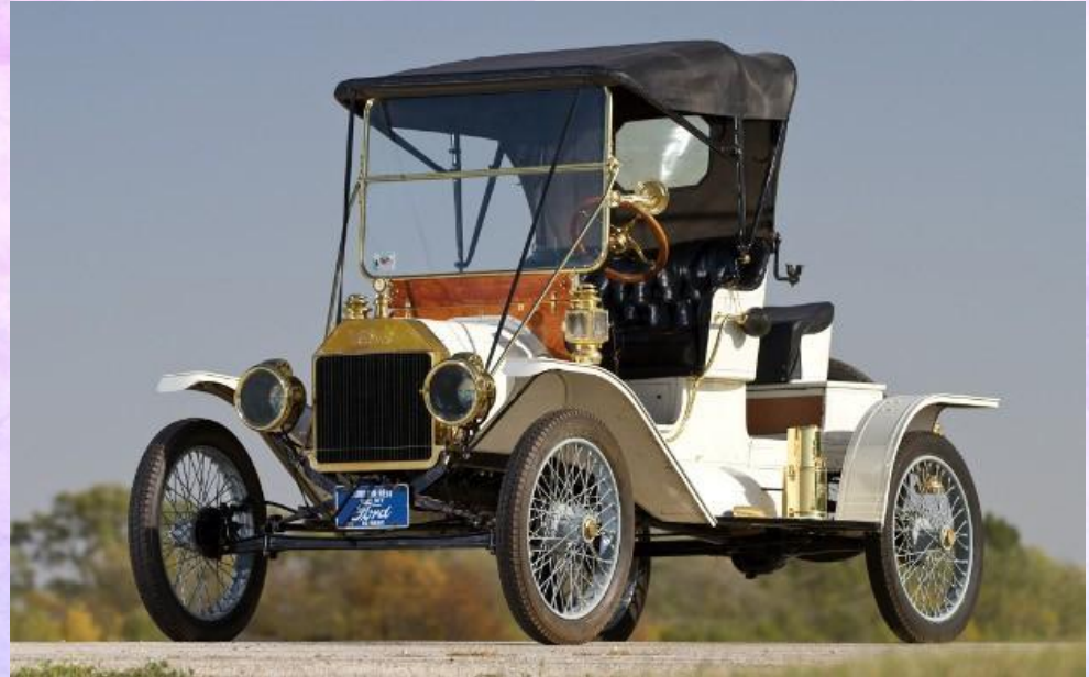
Ford Model T (1908–1927)