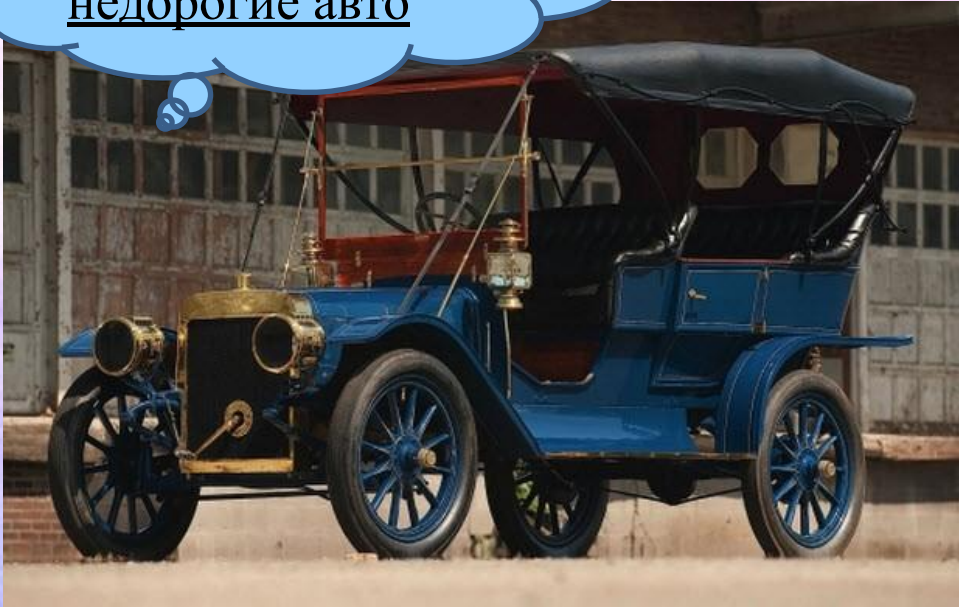
Ford Model K (1906–1908)

Компания была основана 12 бизнесменами во главе с Фордом в 1903 году