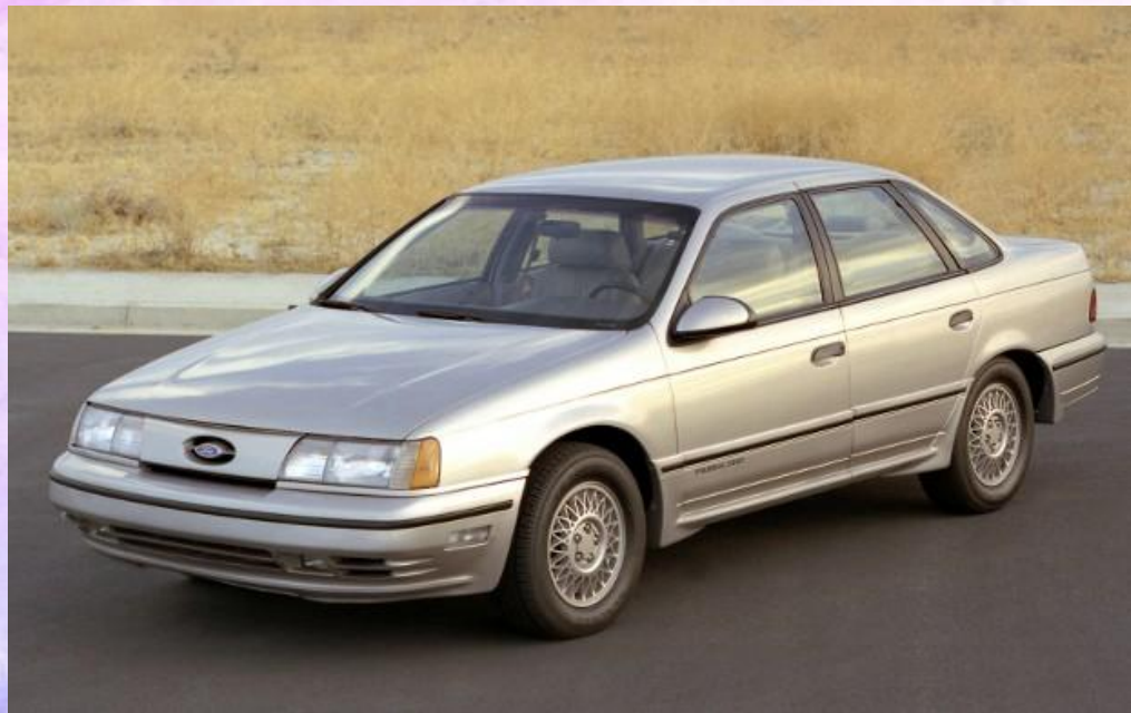
Ford Taurus (1985)