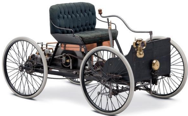
Ford Quadricycle, 1896 г.

Первый двигатель внутреннего сгорания Форд собрал на кухне своего дома. Вскоре он решил поставить двигатель на раму с четырьмя велосипедными колесами.