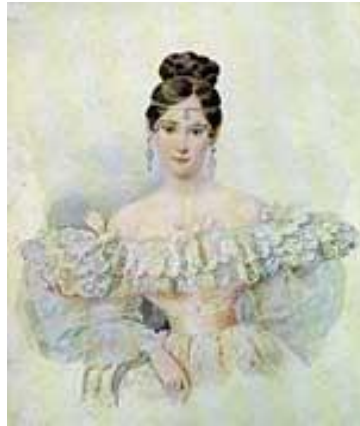
Натали Гончарова - жена А. С. Пушкина. и мать его 4 детей.