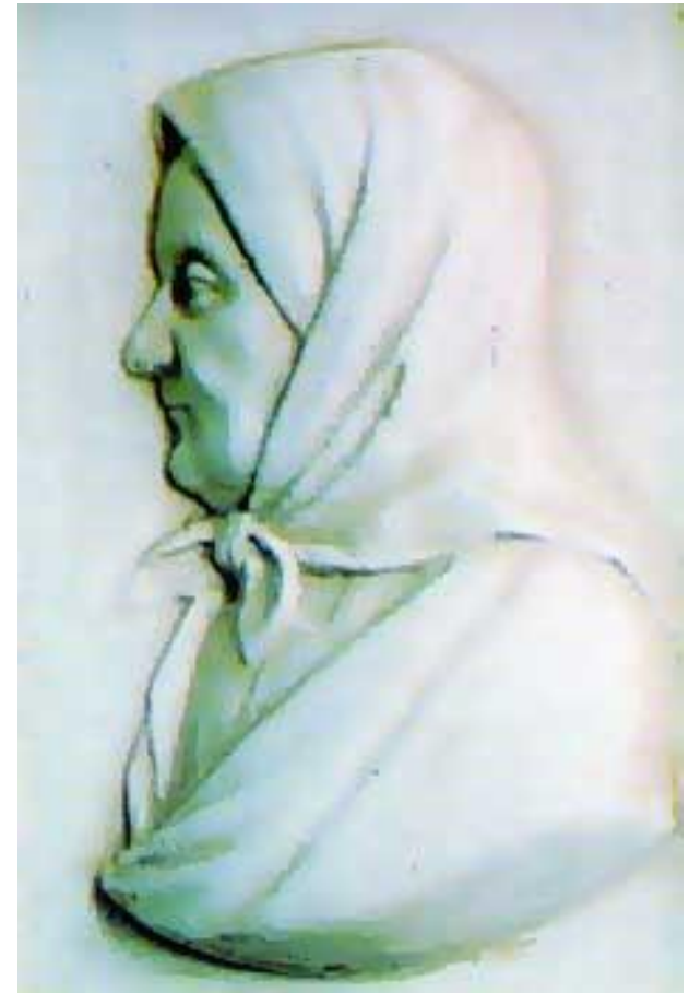
Няня Арина Родионовна