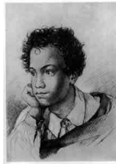
А. С. Пушкин - ученик

Как и принято в дворянских семьях, маленькому Пушкину нанимают гувернера – иностранца. И с 7 лет Саша начинает изучать немецкий, английский и французский языки. Поэтому первые стихи он пишет именно на французском. С 9 лет у Пушкина появляется страсть к чтению. Но из всех предметов Саша так и не полюбил арифметику.