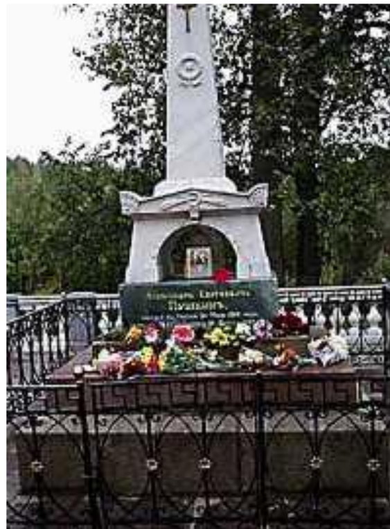
Могила А. С. Пушкина в наше время