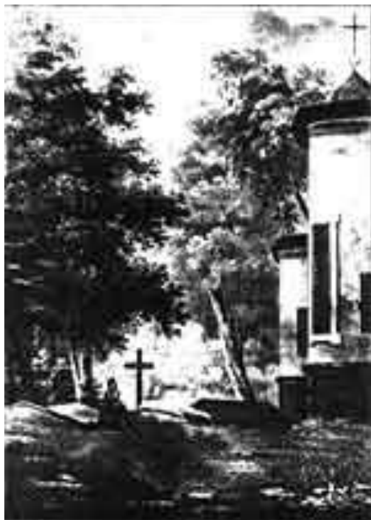
Могила А. С. Пушкина после смерти поэта