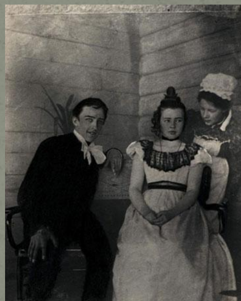
А. Блок в роли Чацкого в любительском спектакле . Боблово. 1898 год.