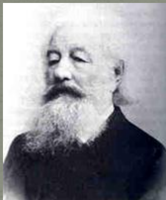
А.Н. Бекетов, дед А.А. Блока. Фотография. 1894 год.