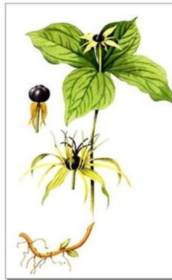
вороний глаз обыкновенный