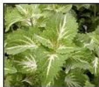
КОЛЕУС шлемниковидный 'Rustic orange'