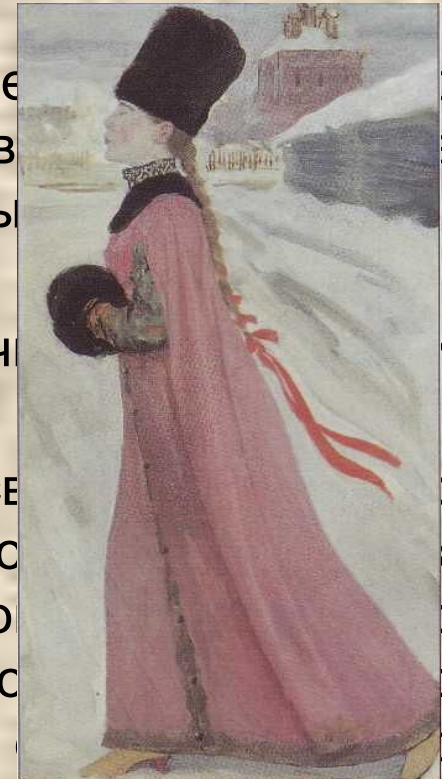
А. П. Рябушкин. Московская девушка.

Появление в произведении нового взгляды на человека позволяет ученым говорить о том, что «Повесть» представляет собой своеобразное связующее звено между литературой средних веков и нового времени (XVIII века).