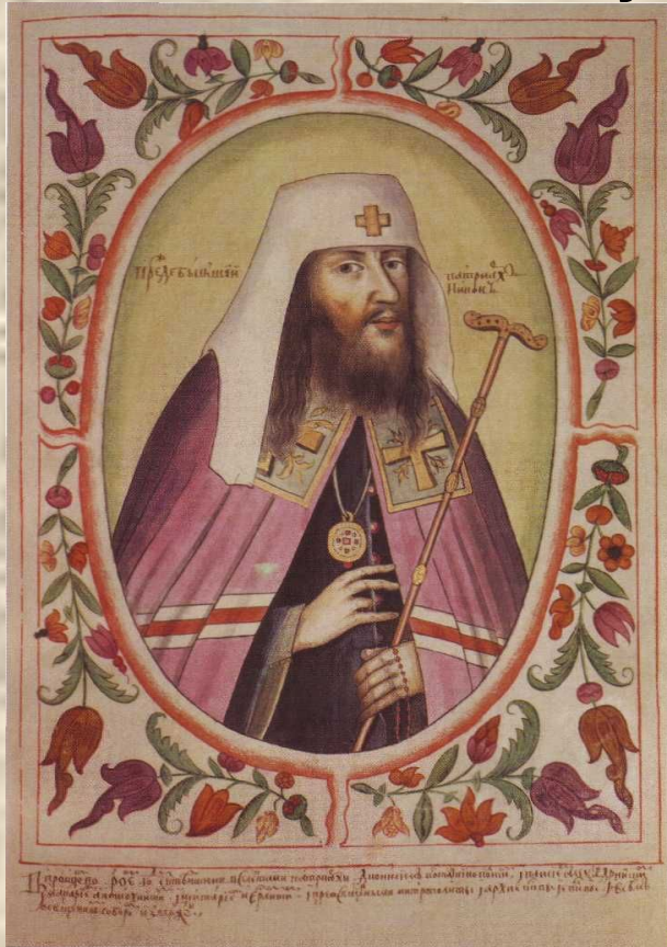
Патриарх Никон. Миниатюра из «Титулярника». XVII век.