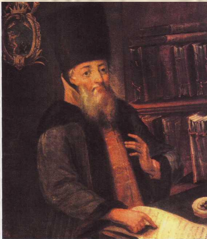
Начальник Посольского приказа боярин А. Л. Ордин-Нащокин.