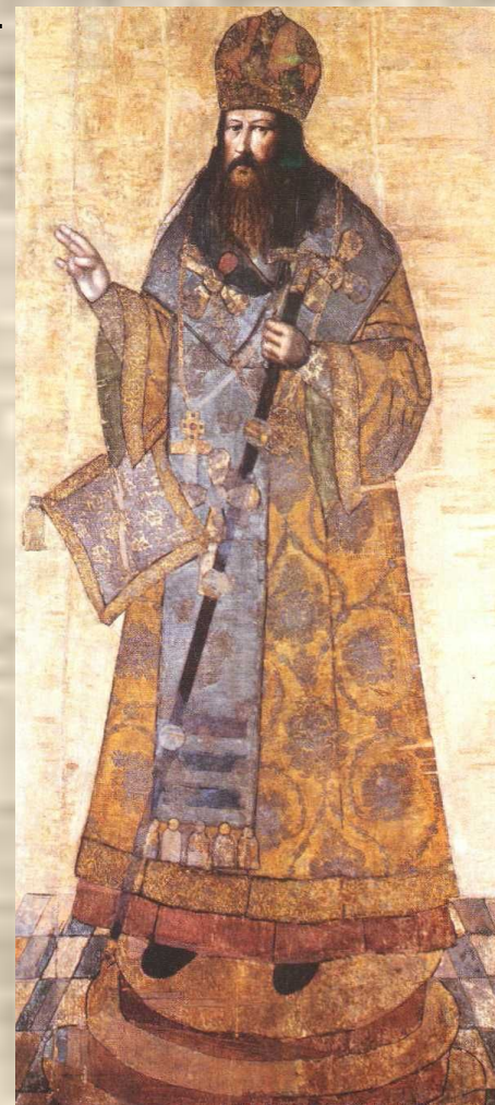
Патриарх Никон. Неизвестный художник.