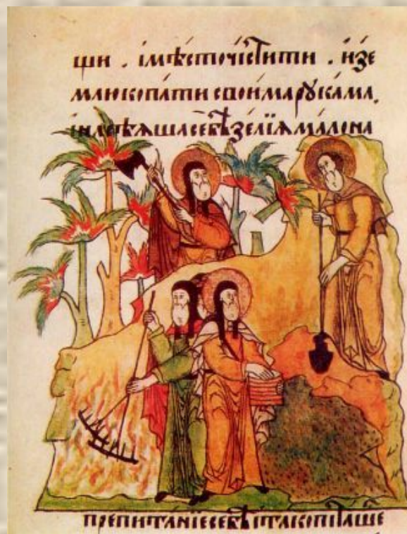
Полевые работы. Житие Антония Сийского. 1648 год.

Да он же, архимандрит, приказал старцу Уару в полночь с дубиной по кельям ходить, в двери колотить, нашу братию будить, велит часто к обедне ходить.