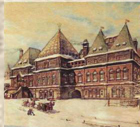
Москва. Боярские палаты XVII (17) в. Рисунок Д. П. Сухова

□ Религиозные мотивы в произведении не говорит о влиянии на героя каких-