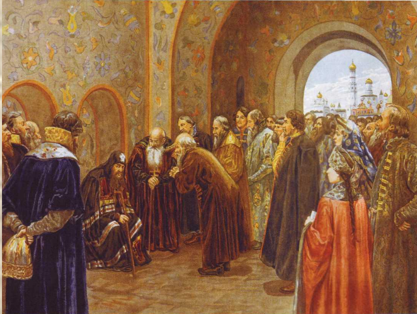
Патриарх Никон. Худ. Милорадович С.Д.