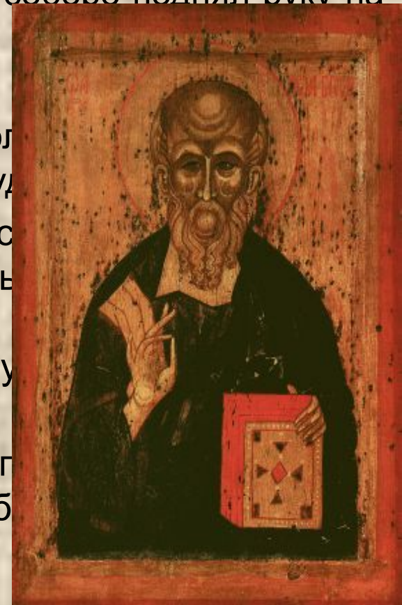
Святой апостол и евангелист Иоанн Богослов. Икона. Конец XV века.