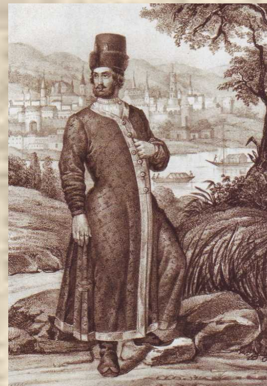
Русская одежда с XIV до XVIII в. Термек и шапка мурмолка (вид изображает г. Астрахань в начале XVII в.). Литография. XIX в.