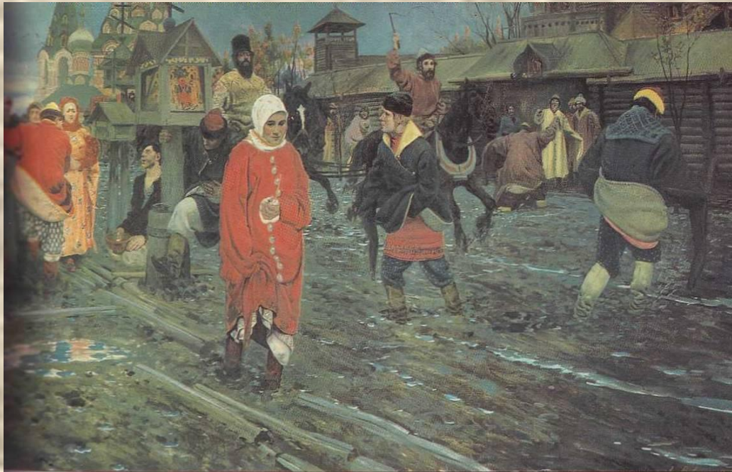
А. П. Рябушкин. Московская улица XVII века.