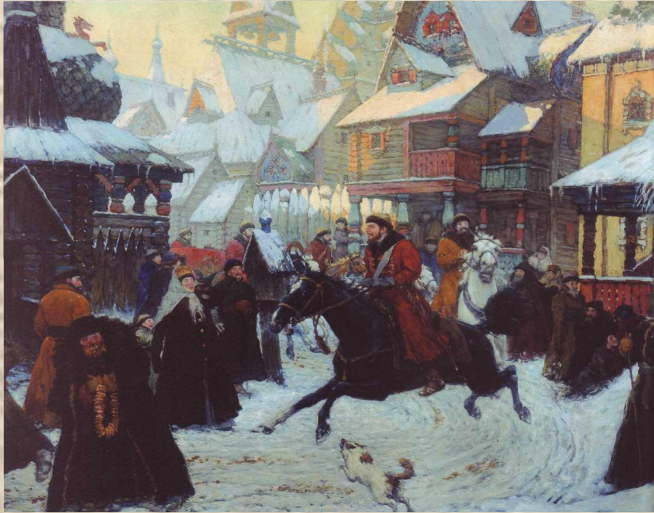
Древнерусский город. Неизвестный художник.