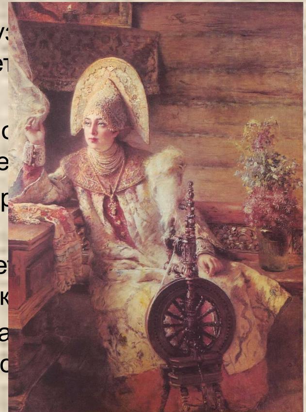
Боярышня. Худ.Маковский К.Е.