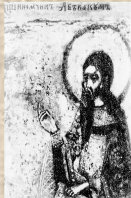
Протопоп Аввакум. Фрагмент стаобрядческой иконы кон. XVI I - нач. XVII векаI

Неронов дал Аввакуме право служить в одном из пределов Казанского собора .