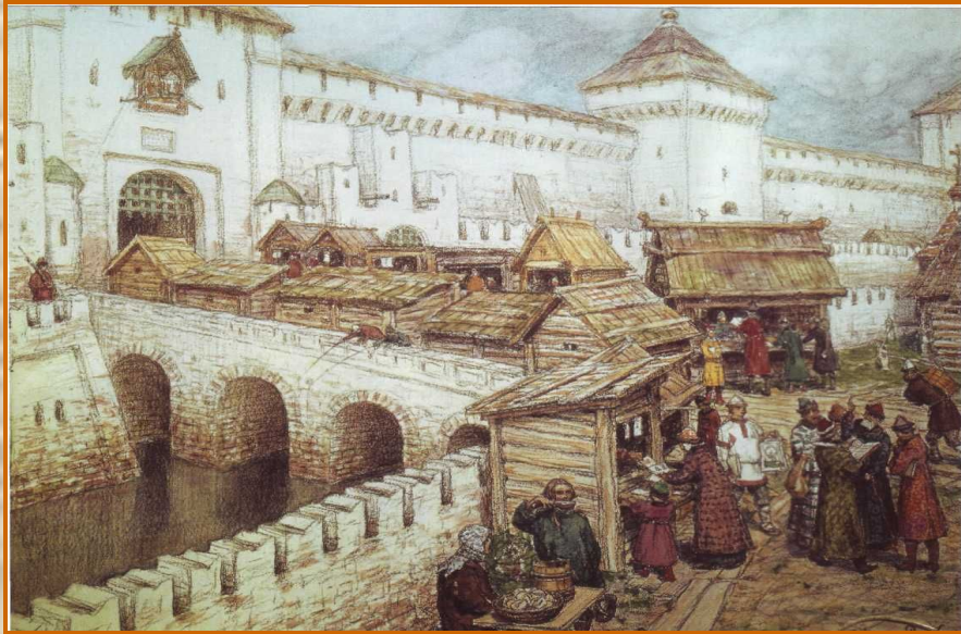
Книжные лавки на Спасском мосту в XVII веке.