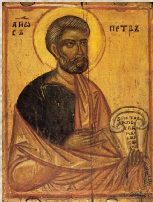
Апостол Петр. Икона. Конец XIV века.