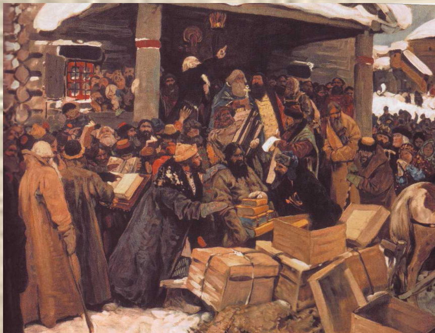
Во время раскола. Худ. Иванов С.В.

Став патриархом, Никон в 1653 году провел церковную реформу. Ее проведение было связано со стремлением Никона превратить Русскую церковь в центр мирового православия.