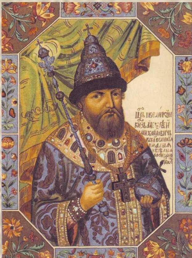
Царь Алексей Михайлович. Миниатюра из «Царского титулярника». XVII век.