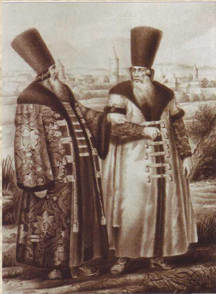
Русская одежда с XIV до XVIII в. Турские шубы и горлатные шапки (вид изображает г. Саратов в начале XVII в.). Литография. XIX в.