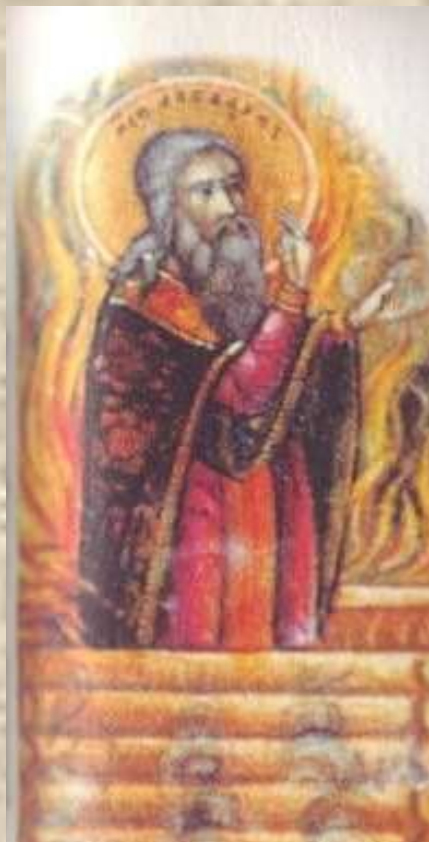
Сожжение протопопа Аввакума. Старообрядческая икона.

Старообрядцев предали анафеме, расстригли тех, кто принадлежал к духовенству, подвергли многих как еретиков урезанию языка и разослали по тюрьмам.