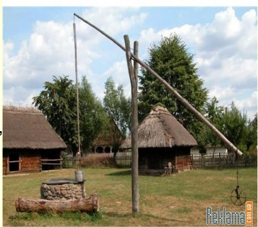
Подвір'я української садиби. Криниця