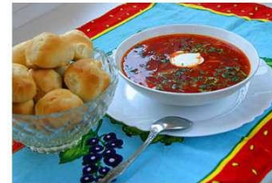
Борщ з пампушками