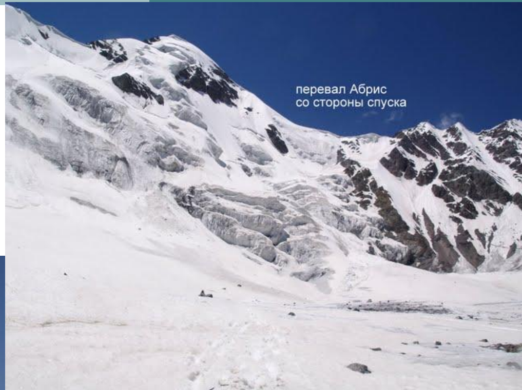
перевал Абрис со стороны спуска