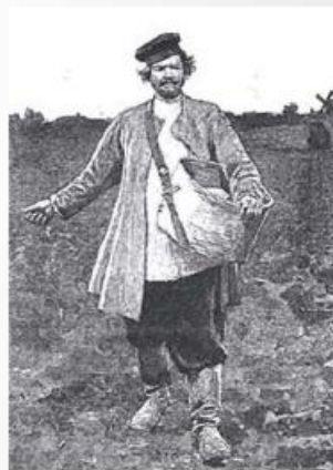
Помещичье землевладение и малоземелье крестьян