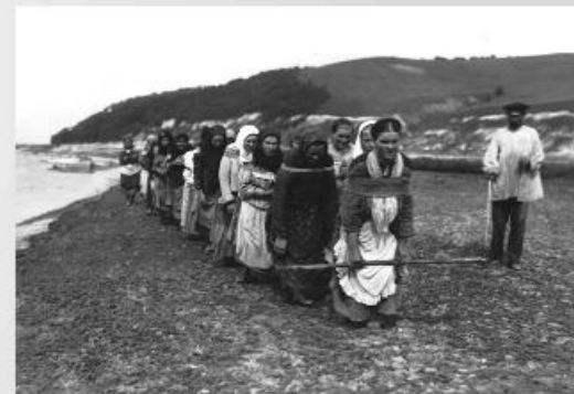
Неравноправие народов России