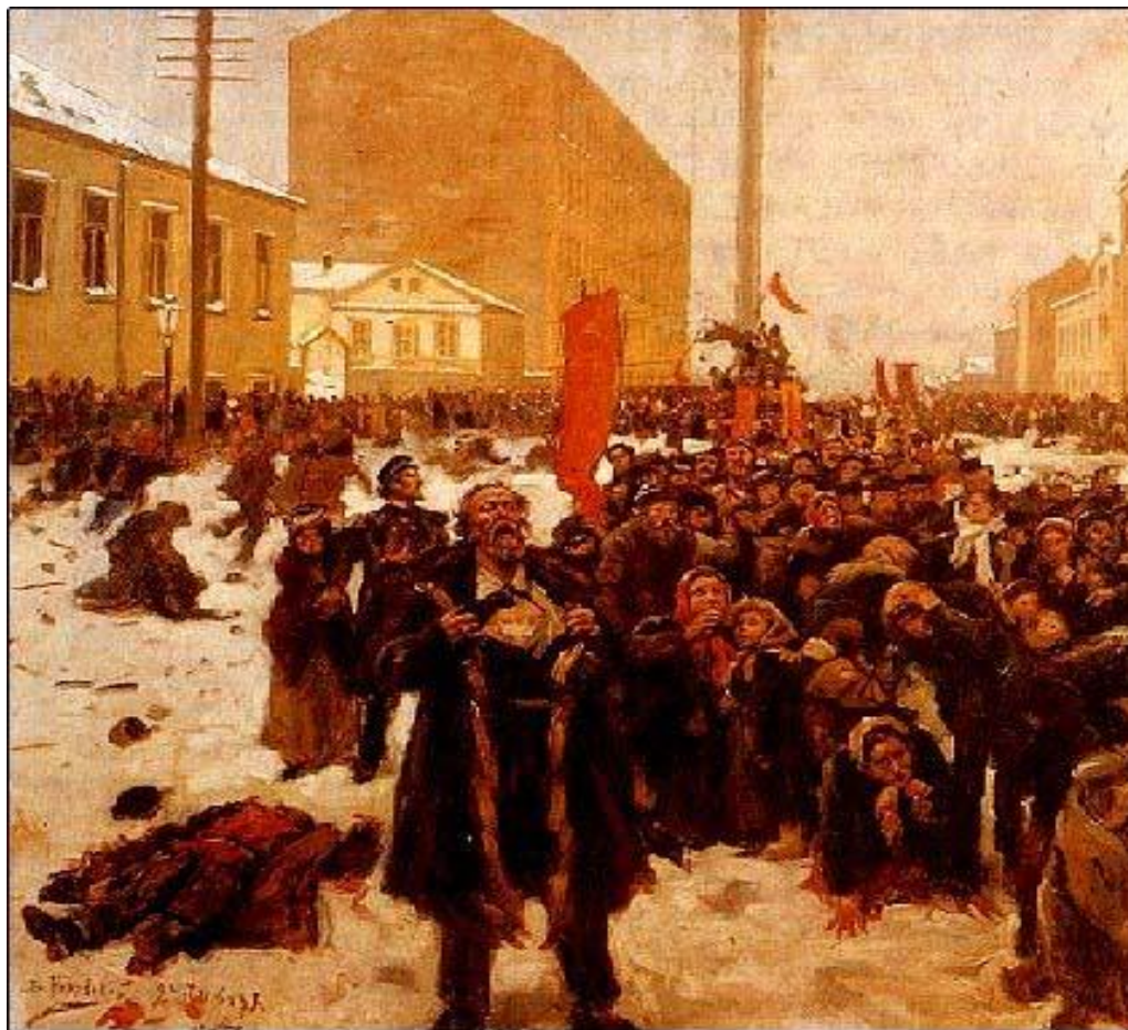
Маковский В. 9 января 1905 г.