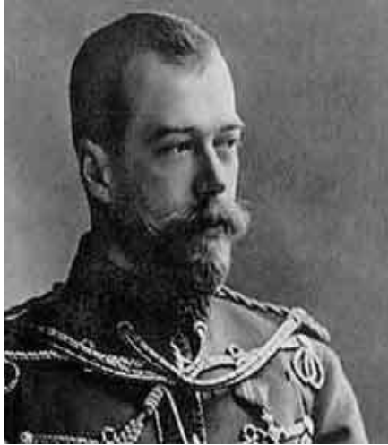
Николай II (1894-1917 гг.)