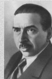
Бухарин А.И. Рыков М.П. Томский

Исключение из партии в 1929 г. 149 тыс. человек.