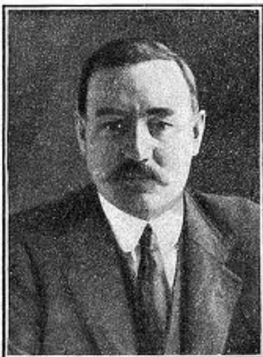
А. Г. Шляпников