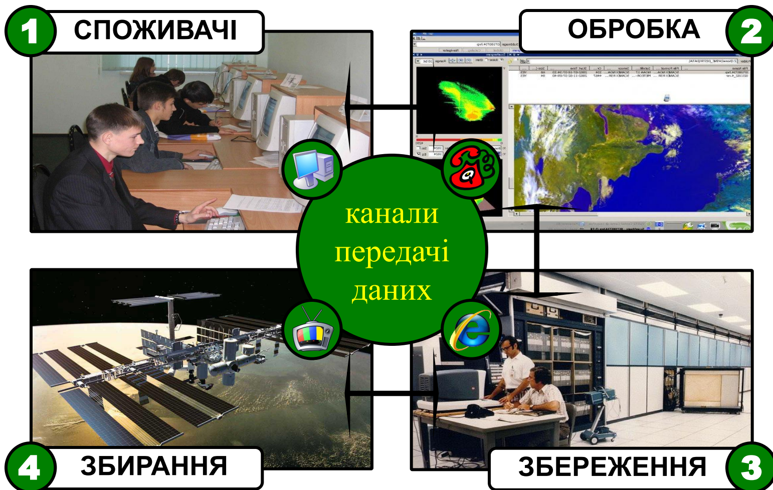
Схема роботи інформаційної системи

Інформація. Інформаційні процеси та системи