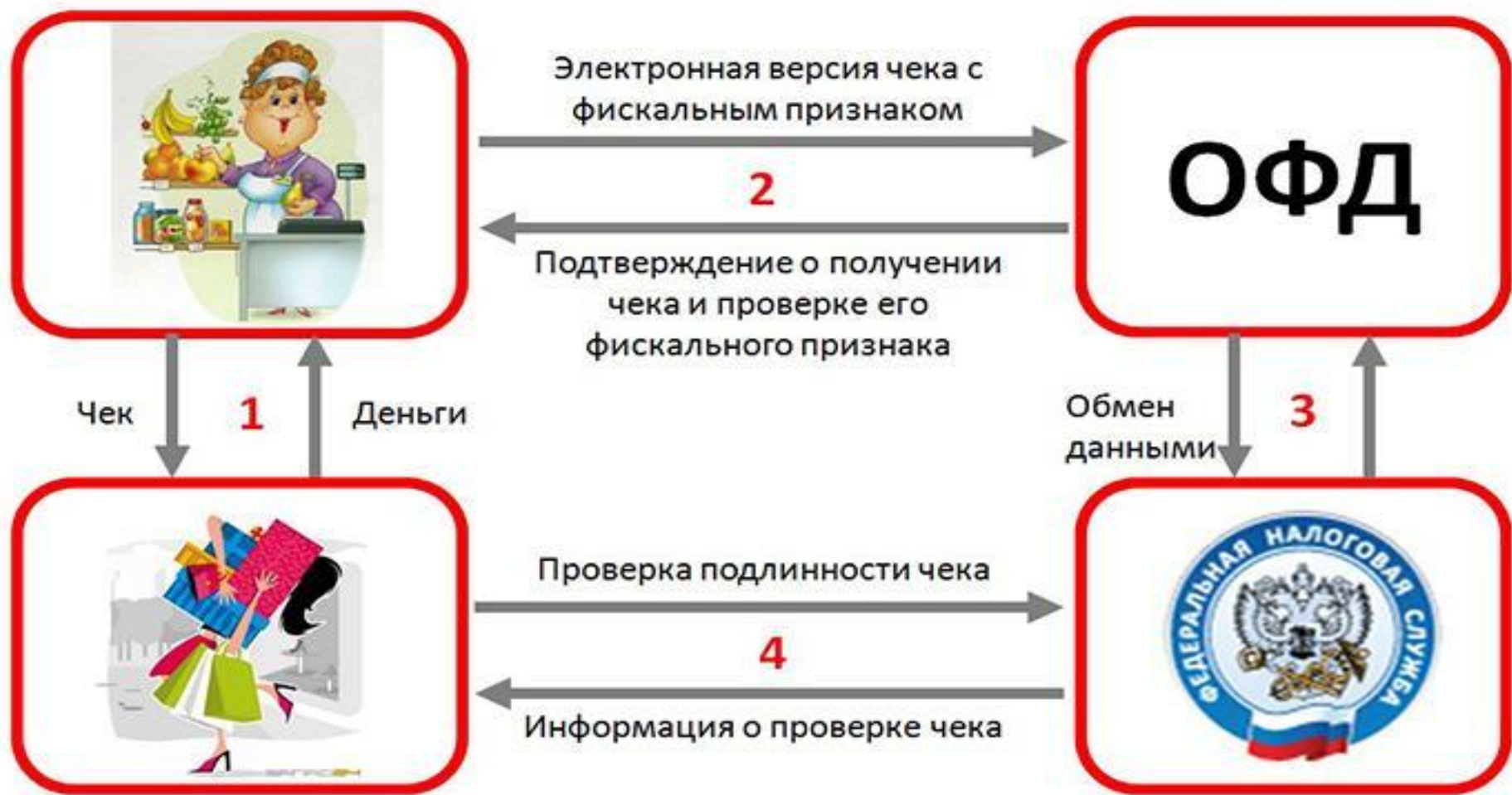
Схема работы при применении онлайн-кассы