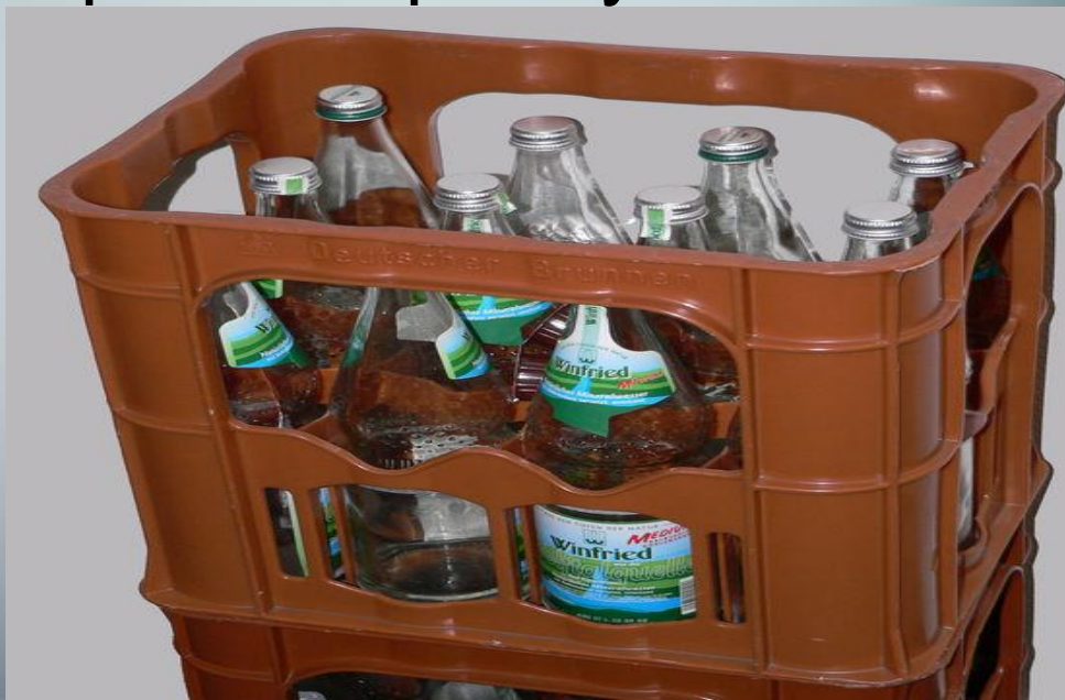
Ящик з поліетилену високої щільності для скляних пляшок