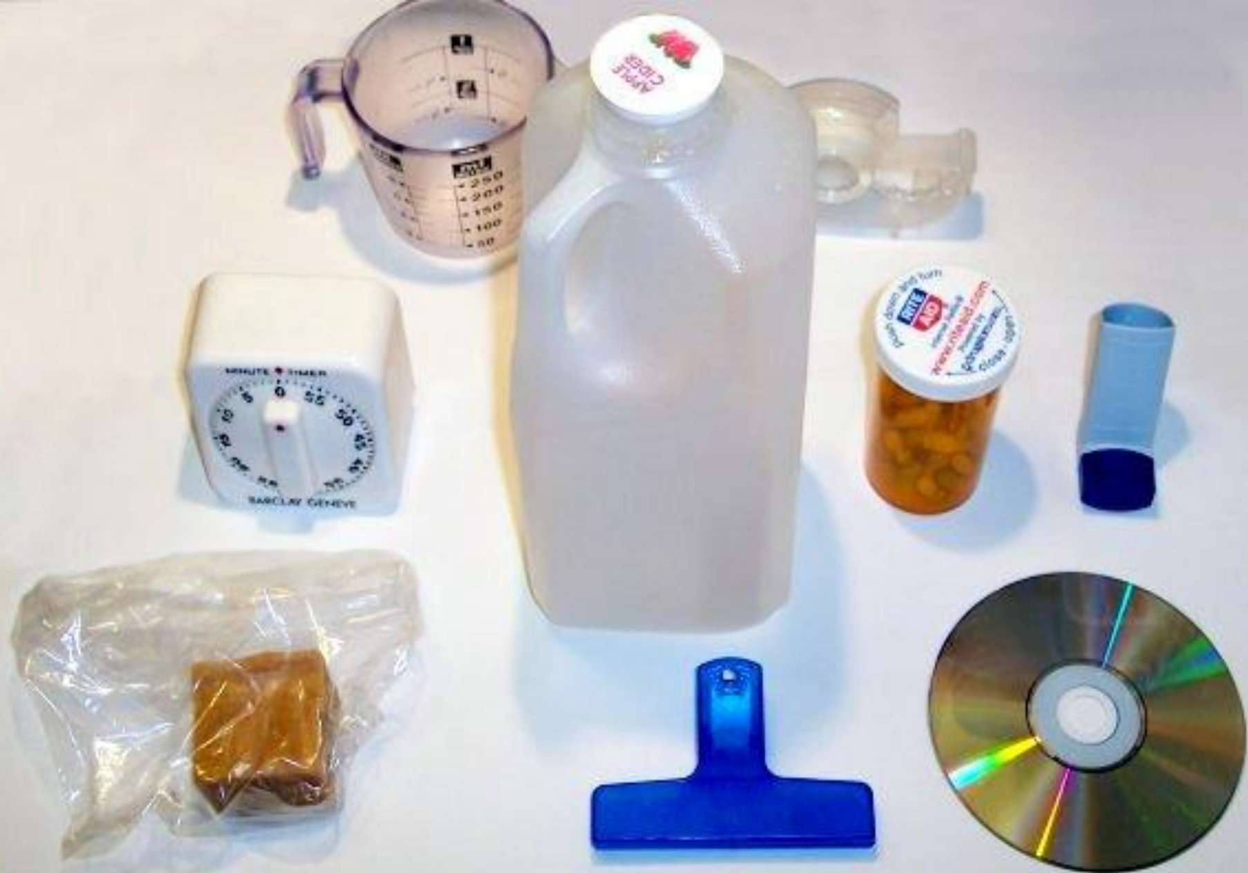
Предмети побуту, повністю або частково виготовлені з пластмаси