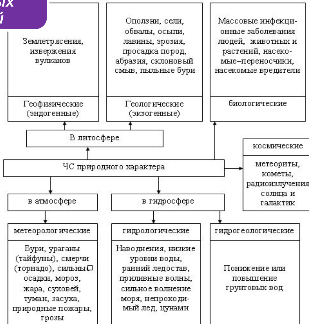
Рис. Классификация ЧС природного характера