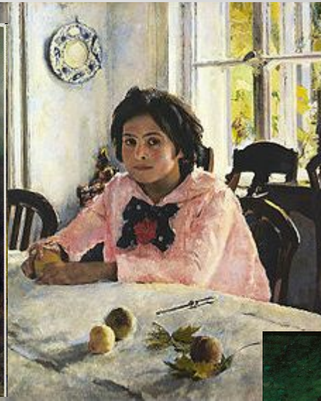
«Девочка с персиками» В. Серов