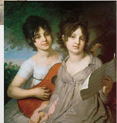
«Портрет сестер Гагариных»