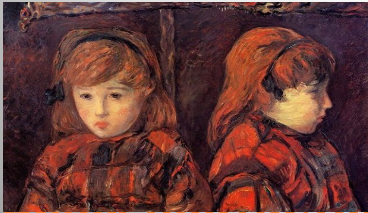
«Двойной портрет молодой девушки» Поль Гоген