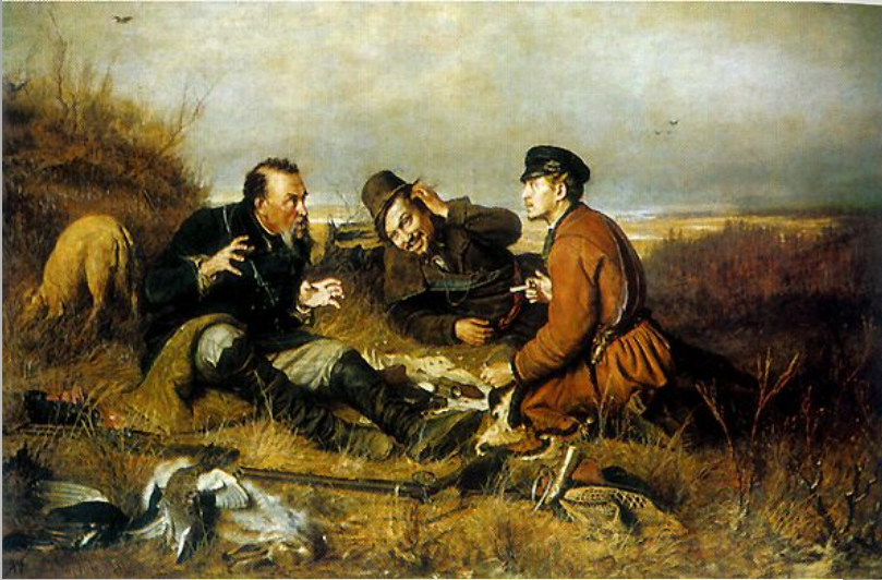
«Охотники на привале» В.Г. Перов