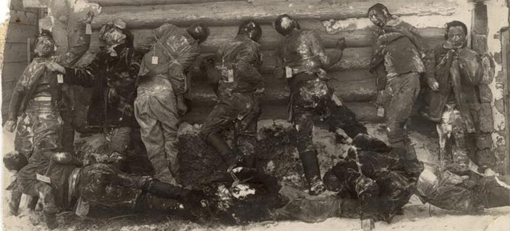
Жертвы Колчака в Ново-Сибирске. 1919 г.

жертвы зверски замученных товарищей бандами Колчака при отступлении их из г. Тобо- Коллевецка 24 января 1919 г. Все эти несчастные товарищи содержались при суровой Колча- кской тюрьме до отступления банд.