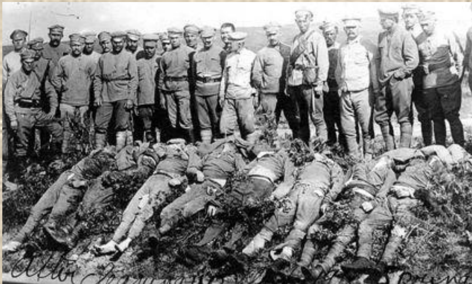
Большевики, убитые чехами под Владивостоком