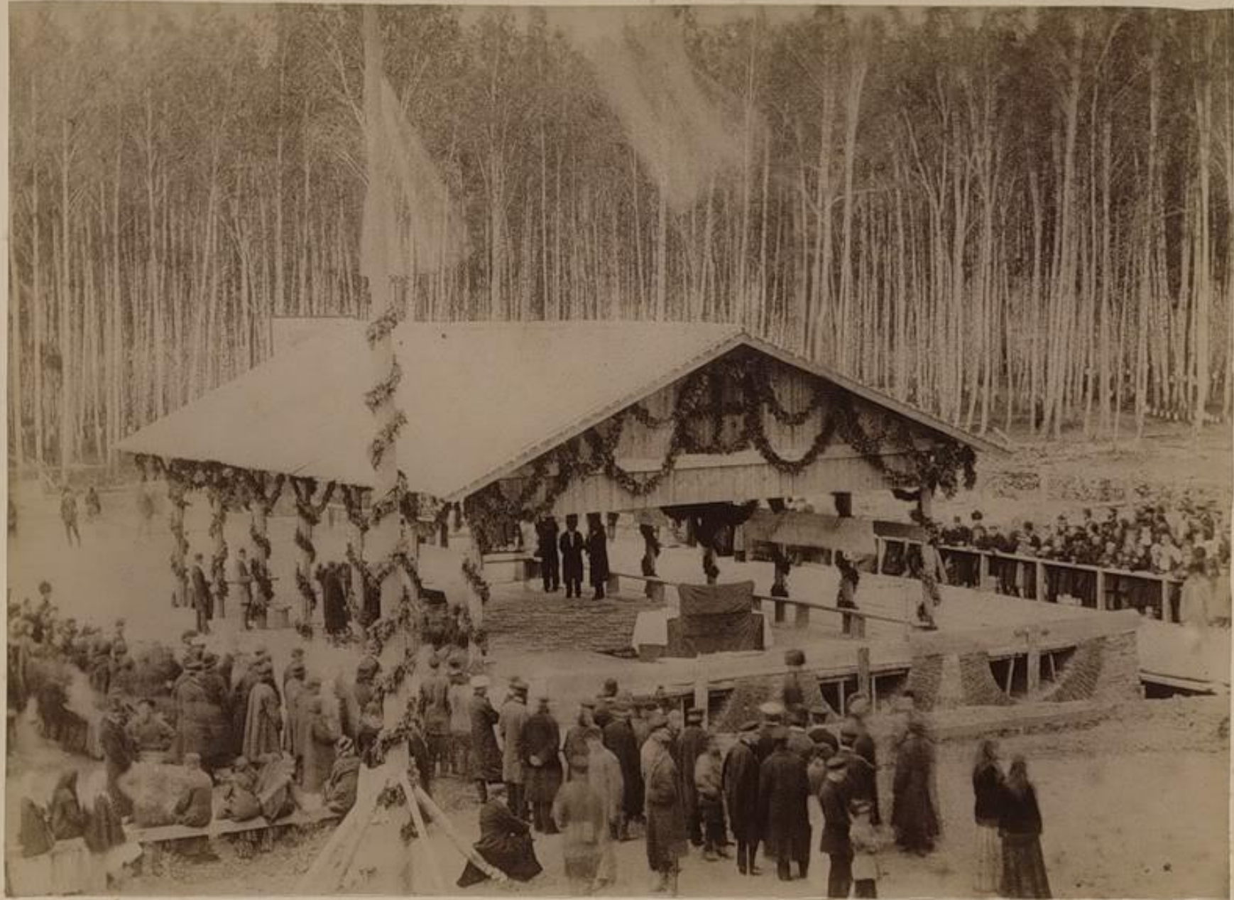
Закладка Императорскаго Томскаго университета 26 августа 1880 года.