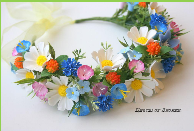
Цветы от Виолки