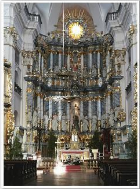
20-метровы цэнтральны алтар касцёла Францыска Ксаверыя ў Гродне (1736 г.). Дрэва, таніраванае пад мрамур (сучасны выгляд)