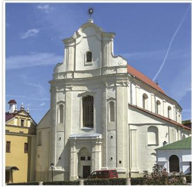
Касцёл Святога Іосіфа. Менск. 1652 г. (сучасны выгляд)