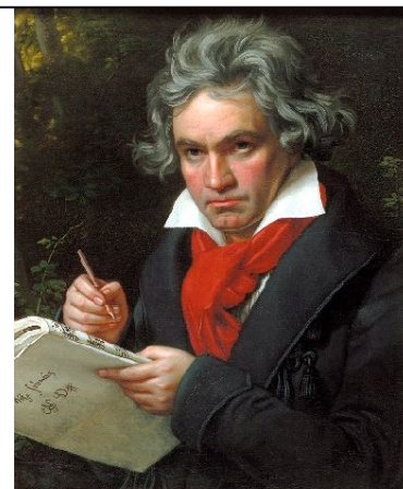
Людвиг ван Бетховен (1770 - 1827)