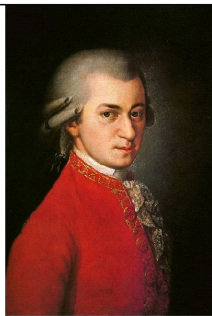
Вольфганг Амадей Моцарт (1756 - 1791)