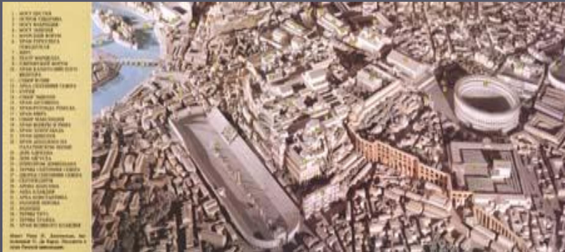
Древний Рим. Реконструкция III в. до н.э. - I в. н.э. Хранится в Музее Римской цивилизации, Рим, Италия Худ. И. Джизмонди