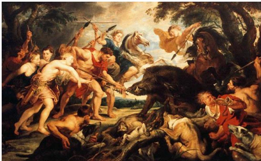
P. P. Rubens 1577-1640: Jagd des Meleager und der Atalante.

Само святилище Дианы Арицийской находилось неподалеку от прекрасного озера (современное озеро Неми), окруженного лесистыми горами. Здесь же, за храмом, зеленела роща у источника нимфы Эгерии. В этой роще мог укрыться любой беглый раб или преступник, но для того, чтобы получить убежище, он должен был стать жрецом богини, сорвав ветвь со священного дерева. При этом он был обязан вступить в бой со жрецом, который охранял священную рощу, и убить его, чтобы занять освободившееся место. Этот кровавый обряд, несомненно, сохранял черты первобытного культа Дианы Неморензис, требовавшей когда-то человеческих жертв. Он очень сближал культ римской Дианы с культом греческой Артемиды в Тавриде.