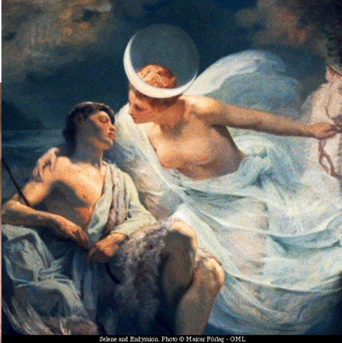
Selene and Endymion.