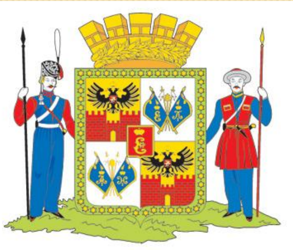
Герб города Краснодара