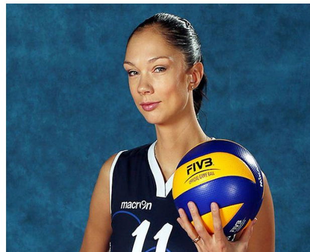
Екатерина Гамова (Россия)