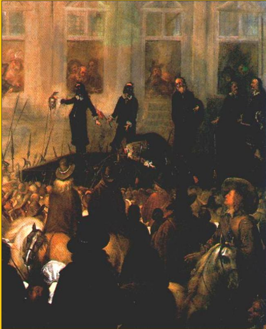
Страта Карла I