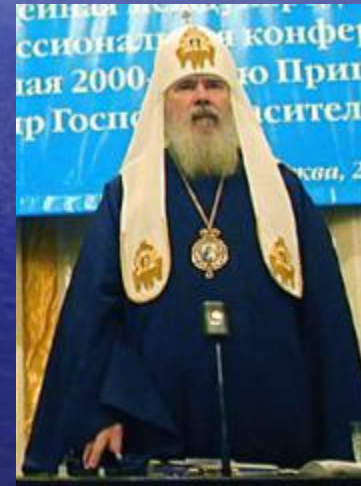
Восточная (православная) церковь