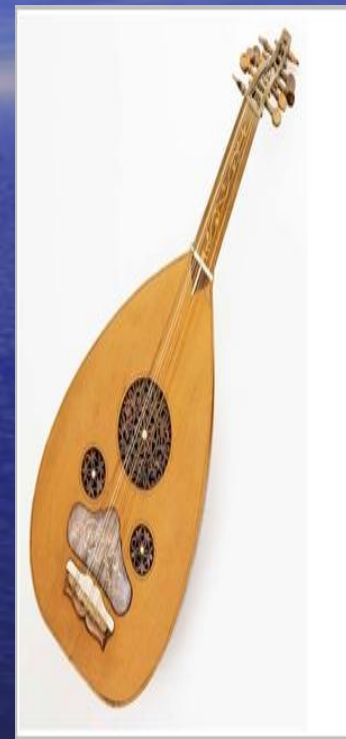
Лютня или виола