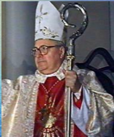
Западная (католическая) церковь