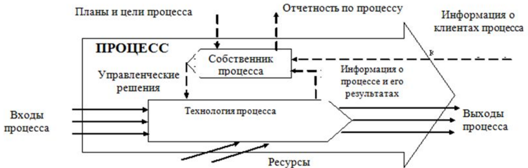
Рисунок 1.1 – Концептуальная схема управления бизнес- процессом

информационные потоки. Таким образом, получим общую схему управления процессом, которая приведена на рис. 1.1.