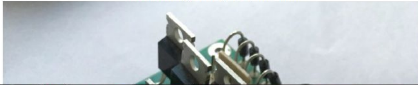
Фото контроллера, двигателя