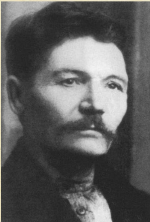
Платон Фирсович Климентов (1870–1952)