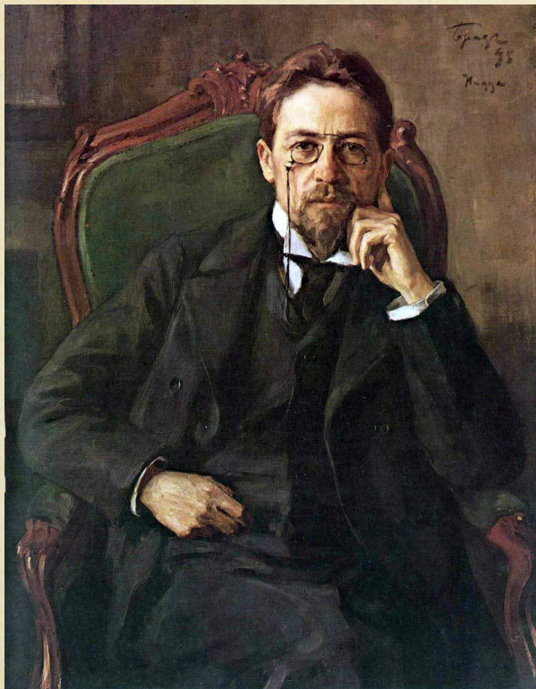
Антон Павлович Чехов (1860–1904 гг.)