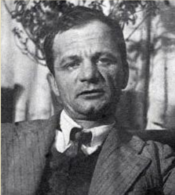
Андрей Платонович Платонов (1899–1951 гг.)